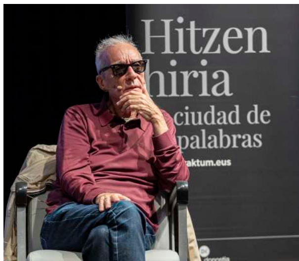
Juan José Millás