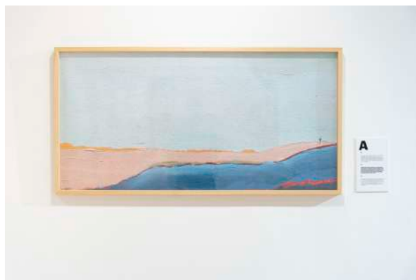
Exposición Isoia , Nerea Urrestarazu

Para quienes no pudieron asistir o desean revivir los encuentros, los audios de las actividades están disponibles en la web de Literaktum , DK ON! , DK Irratia y en las principales plataformas de pódcast.