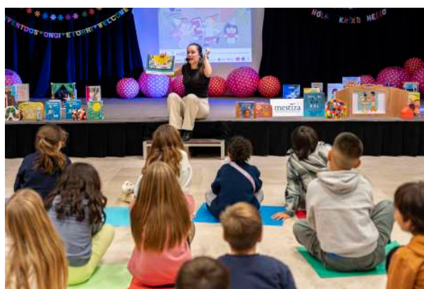
9ª fiesta del Día Universal de la Infancia