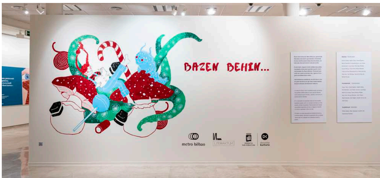
Exposición Bazen Behin