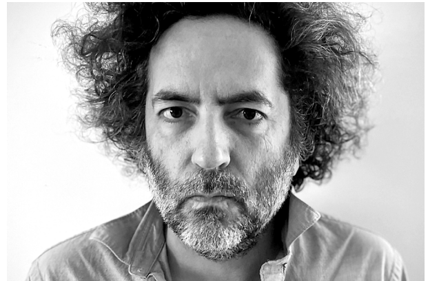
Destroyer