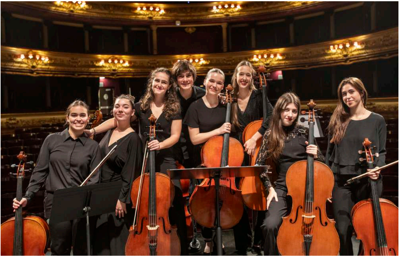
Euskadiko Gazte Orkestra

La música clásica y contemporánea, así como la zarzuela, tuvieron como escenario el Teatro Victoria Eugenia y la Sala Club, con la presencia de la Euskadiko Gazte Orkestra en dos ocasiones y el V Ciclo Batura , que contó con intérpretes de reconocido prestigio. En el ámbito de la zarzuela se representaron dos obras: La isla de las Perlas y Los Gavilanes .