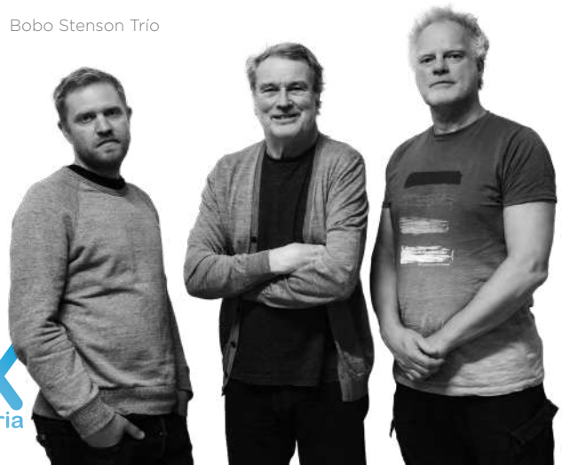
Bobo Stenson Trío

En total se celebraron 52 conciertos, con más de 20.000 espectadores y espectadoras.