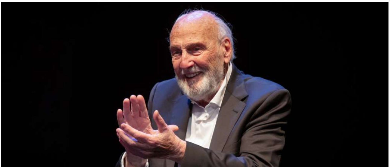
Una pequeña historia , Héctor Alterio

Azkenik, nabarmentzekoa da orain dela 25 urte baino gehiagotik helduei zuzendutako euskarazko antzerkiaren alde egin den lana. Ahalegin horri esker, Euskal Herriko euskarazko antzerki-programazio erregular bakarra finkatu ahal izan da, eskaria gero eta handiagoa izan dadin lortuz; 2025ean, urrutira joan gabe, dozenaka mila ikusle izan zituzten Donostia Kulturaren agertokietan programatutako ikuskizunek. Programatutako emankizunek izandako batez besteko okupazio-maila handiak —denboraldi guztietatik onena— eta Udal Euskara Zerbitzuarekin izandako lankidetzaren sendoa berretsi egin zuten apustu estrategiko eta kultural honen egokitasuna.