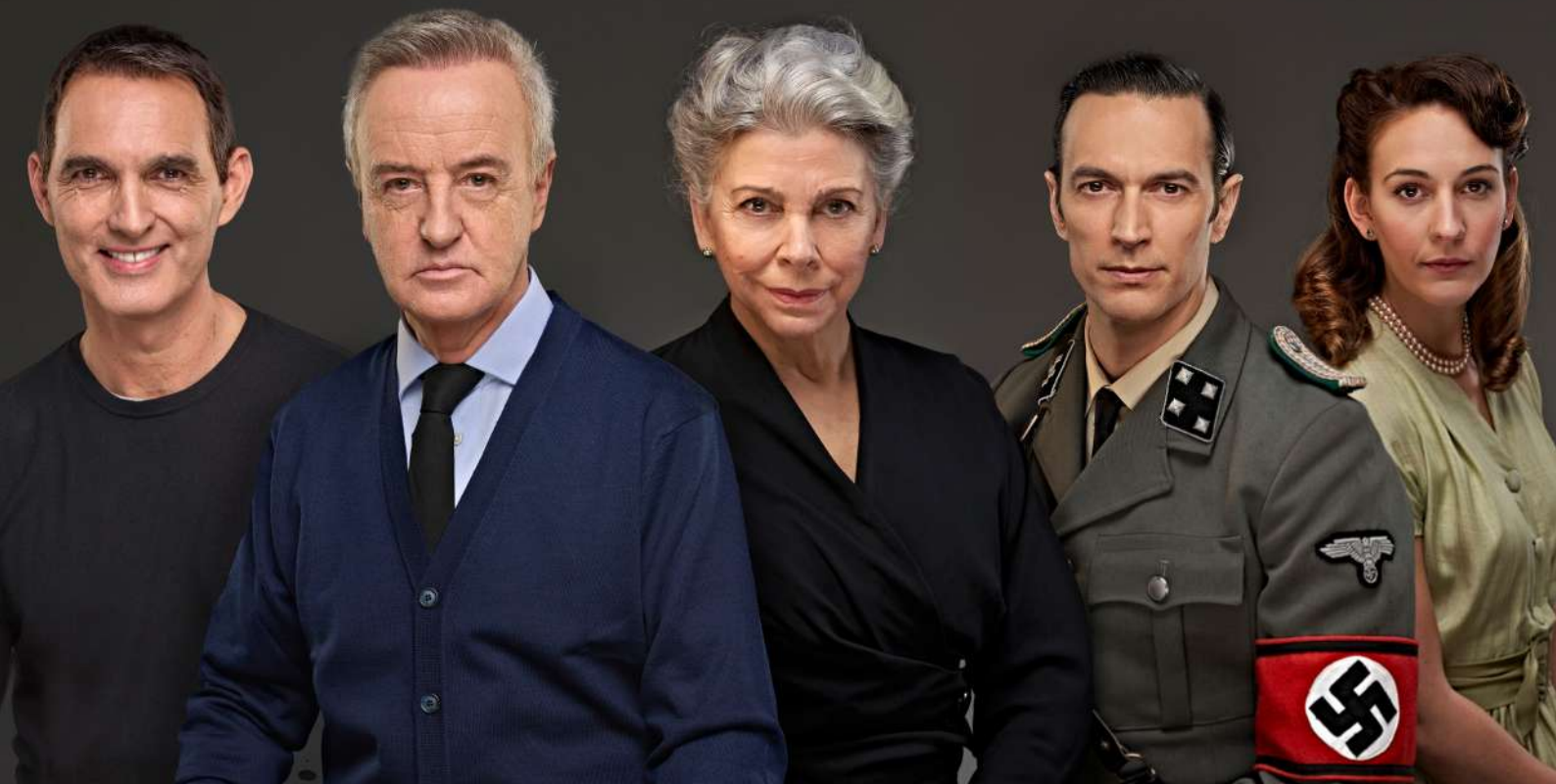
Música para Hitler, Txalo Producciones