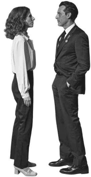
Carmen, nada de nadie

Haurrei zuzendutako ikuskizunetarako laguntza.