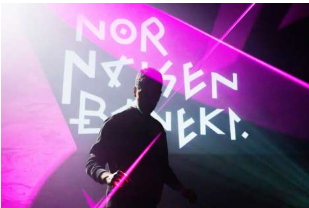
Nor naizen baneki, Artedrama

Euskarazko antzerki-programazioari dagokionez, Dejabu Panpin Laborategia izan genuen Itzulera ikuskizunarekin, Artedrama konpainiaren Nor naizen baneki , eta gaztelerazko beste ikuskizun garaikide batzuk.