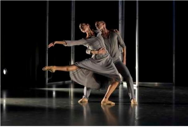
Soirée de Ballets , Malandain Ballet Biarritz

Duende obrak tonu-aldaketa bat ekarri zuen, eta dimentsio ilun eta biziago batean barneratu zen. Lorcaren duende kontzeptuan inspiratuta dago, eta emozio gordina, barne-tentsioa eta dantzariari sakon-sakonetik sortzen zaion egia arakatzeko dituen.