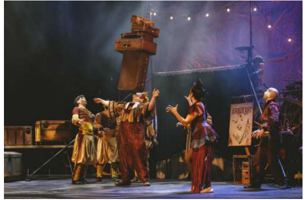
Ambulant , La Fam

Oro har, Soirée de Ballets piezak kalitate artistiko handiko esperientzia eskaini zion publikoari, eskuragarria eta, aldi berean, exigentea, Malandain Ballet Biarritz frantziar ballet neoklasikoaren erreferentzia ukaezina dela berretsi zuena.