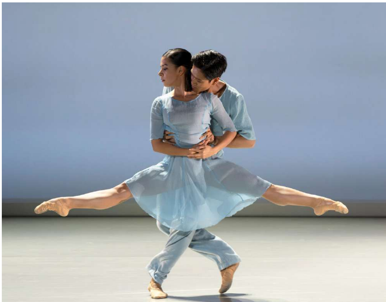
Minuit et demi, ou le Coeur mystérieux , Malandain Ballet Biarritz