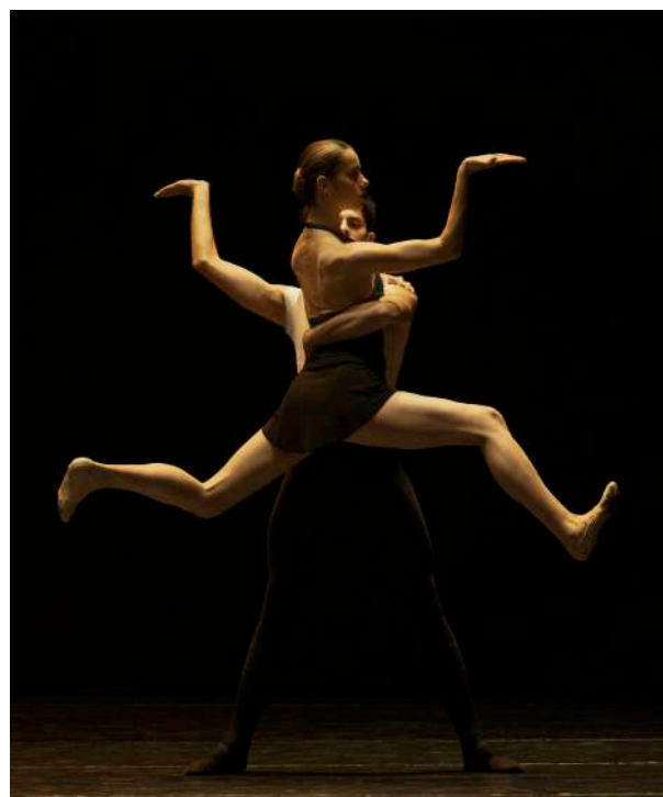
Duende, Nacho Duato

Azkenik, ezinbestekoa da Gipuzkoako Dantzako Profesionalen Elkarteak dantza sustatzeko eta garatzeko egin duen lana aipatzea; horren erakusgarri agerikoena Dantzaren Astea antolatu izana izan zen eta, Victoria Eugenia Antzokiarekin lankidetzan, baita Dantzaren Eguneko Nazioarteko Gala ere, hiriaren kultura-egutegian dagoeneko erabat finkatuta dagoena.