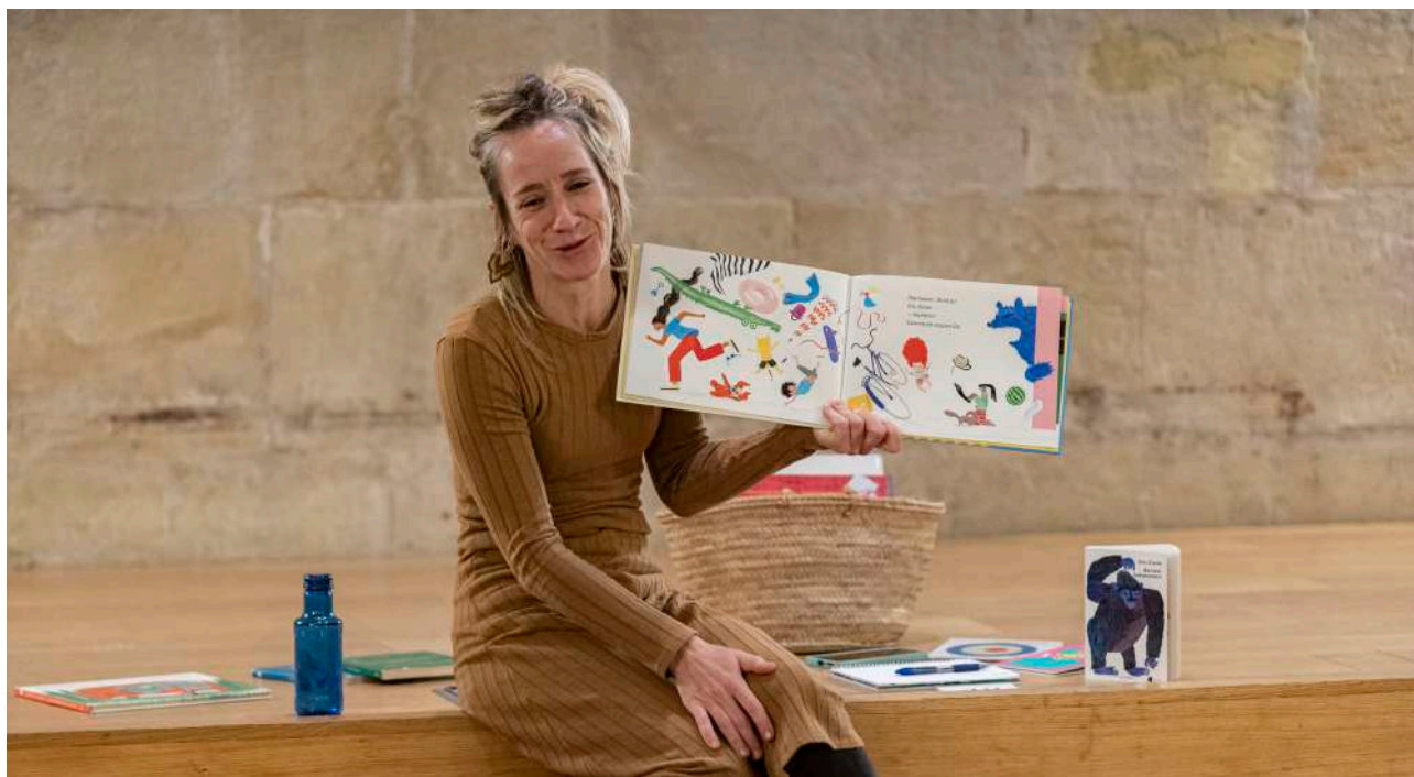
Ipuin Maratoia

Azkenik, lehenengo aldiz egin zen Sendatzen duten hitzak tailerra, euskaraz, Hasier Larretxearekin , irailaren 12an eta 16an. Erabateko arrakasta izan zuen tailer horrek. Saio biak egin ziren San Jeronimo aretoan eta berehala bete ziren. Helburua izan zen min egiten duenari buruz idaztea, musika eta literatura uztartzen dituzten testuak landuz.