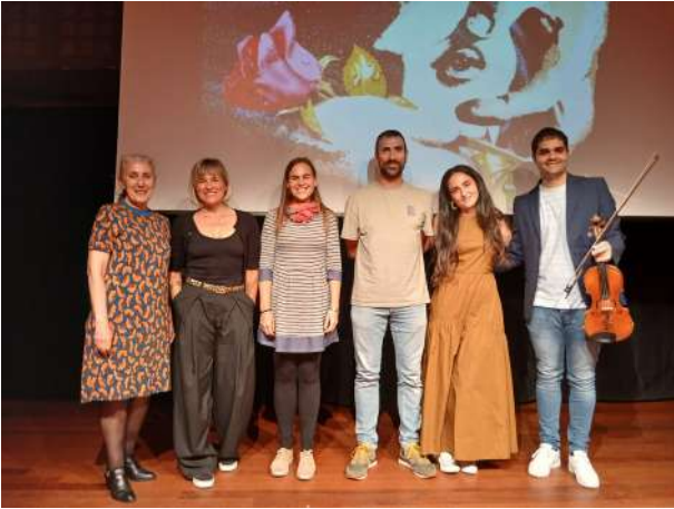
Poesia eta Pentsamendua Topaketa