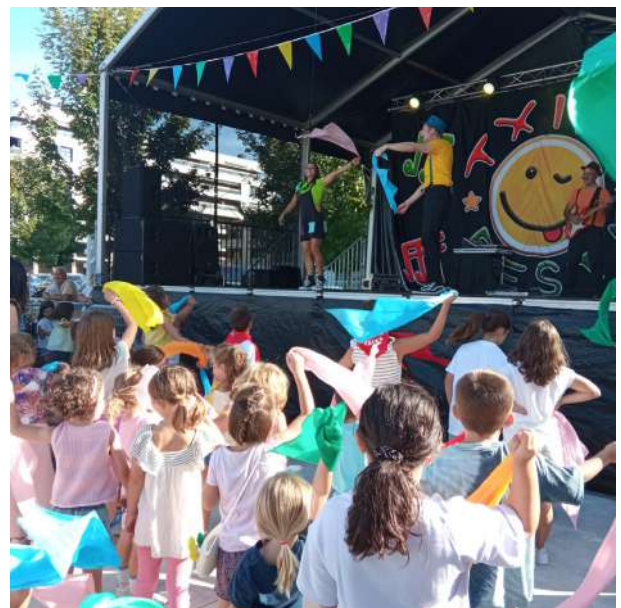
Txulalari, Txiki Festa Txomin Enea