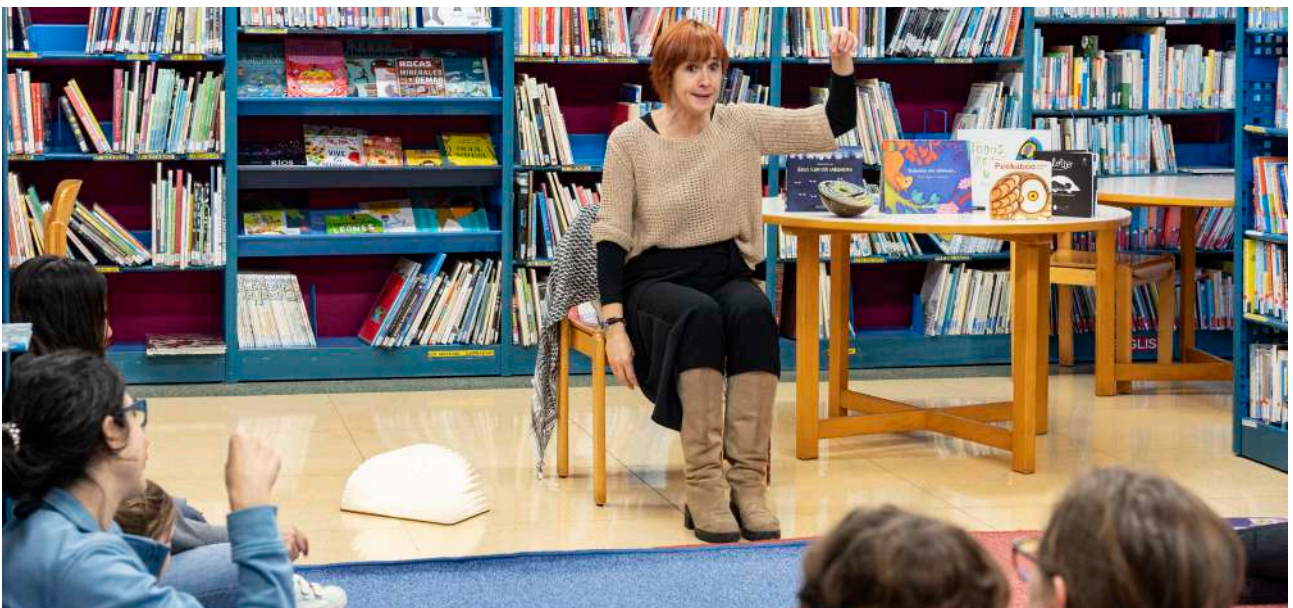
Egin putz, Dorleta Kortazar