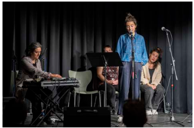
Pleibak, bertso saio literarioa

Para la celebración del Día del Euskara se organizó un teatro infantil con Patata Tropikala y la obra Enperadorearen kondaira .