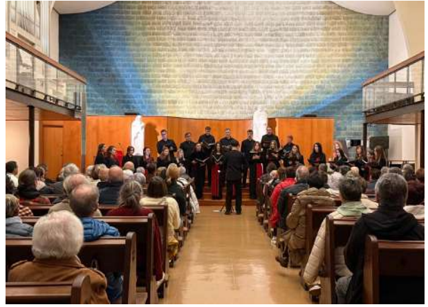
Skovoroda Choir, Semana de Masas Corales