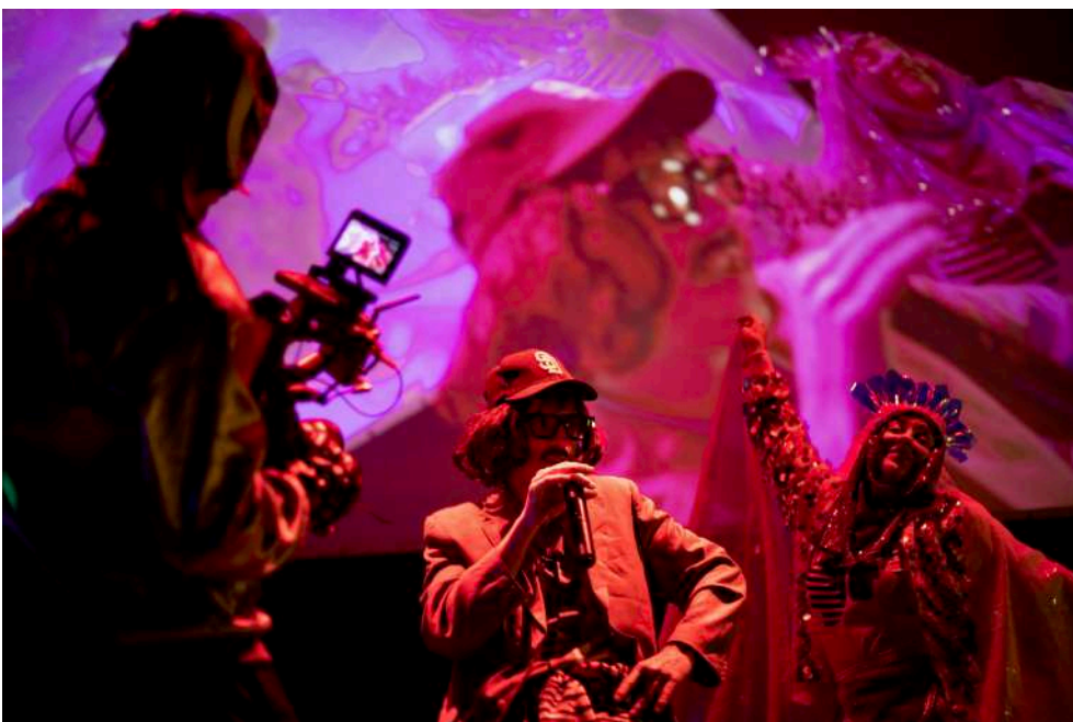
Itzulera, Dejabu Laborategia