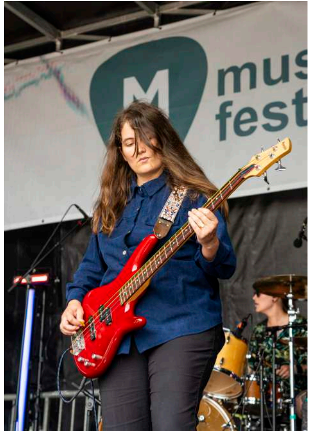
On, Musikagela Fest

Bandas como Suite Seda, On, Invert, WTXW, Latitud 43, Peter Bjorn, Miss B. o Physis vs Nomos , que ensayan habitualmente en Egia K.E. , participaron en Musikagela Weekend o Musikagela Fest , conciertos organizados desde el propio servicio.