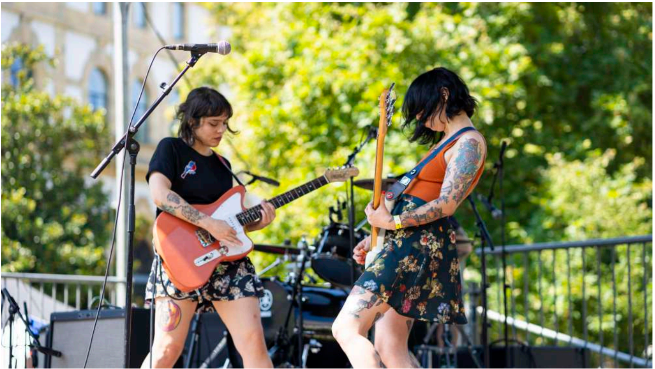
Fin del mundo, Glad is the Day