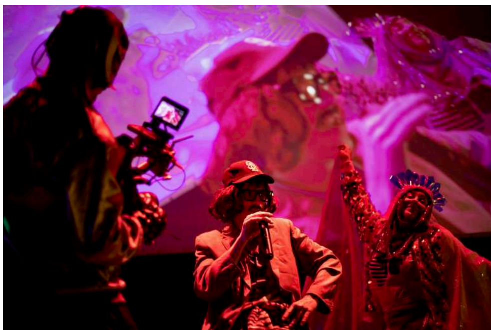
Itzulera, Dejabu Laborategia