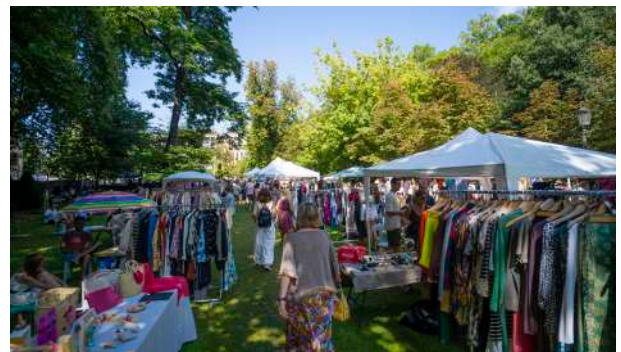
Glad is the Day

El centro cultural colaboró también en diferentes eventos organizados en el barrio, como Porrontxo Jaiak , con una variada oferta de animación infantil, y San Juan Bezpera , un acto plenamente consolidado. Ambas iniciativas contaron con una amplia participación vecinal.