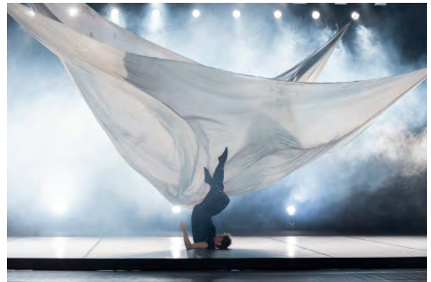
Aracaladanza Loop