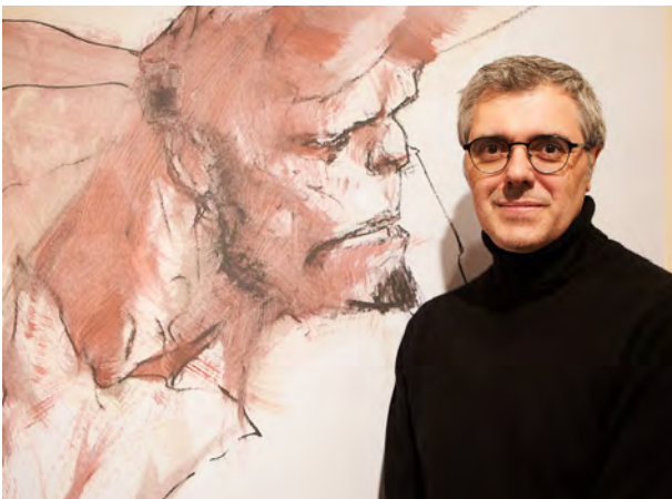
Goya Hell Boy erakusketa, Stéphane Levallois

Goiko aretoan, berriz, hainbat erakusketa interesgarri jarri ziren ikusgai, besteak beste: Catalina de Erauso Arte Klubaren urteurrenari eskainitakoa; Gailurrean izan gaitun , Euskal Herriko emakumeen mendizale bide-urratzaileen argazkiak; Sirenak , Casey Laraek Zurriolako hondartzan ateratako uretako argazkien bilduma; Gipuzkoako Artisten Elkartearen 75.