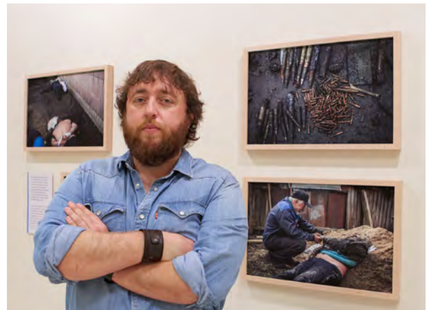
Luis Valtueña Nazioarteko Saria