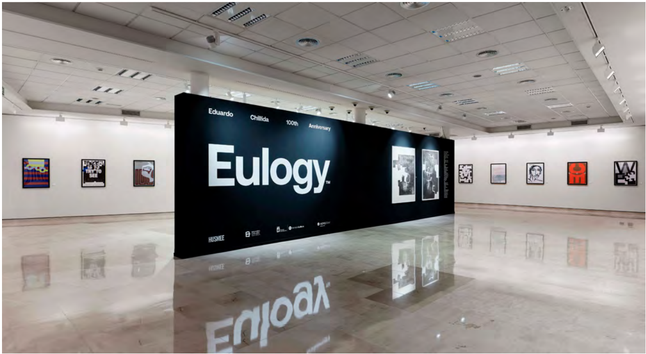
Eulogy Chillida 100 urte erakusketa

urteurrenaren ospakizuna, teknika desberdinak erakutsiz; eta, urte amaieran, Literaktum Jaialdiaren barruan, Anne Rearicken Gure bazterrak argazki sorta zoragarria. Gainera, dagoeneko tradizio bihurtu diren erakusketa kolektiboak ere arrakastatsuak izan ziren, hala nola, Pilar Gracia III. lehiaketako lanak, +55 programako Ereinduz lehiaketakoak edo Okendo Kultur Etxeko arte-ikastaroetako parte-hartzaileen erakusketa plurala.