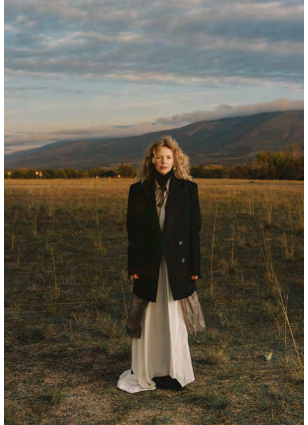
Christina Rosenvinge