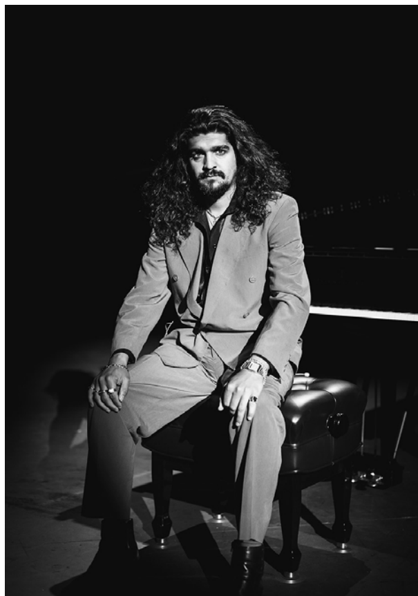
Israel Fernández

Guztira, 23.000 lagun joan ziren programatutako 55 kontzertuetara.