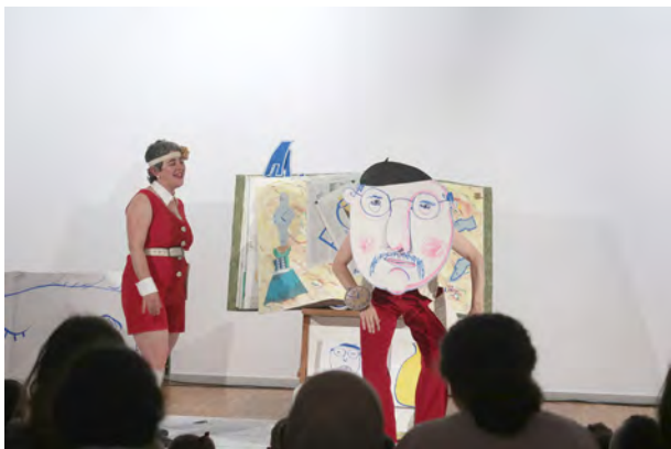
Boli, bili, boli, Pantzart