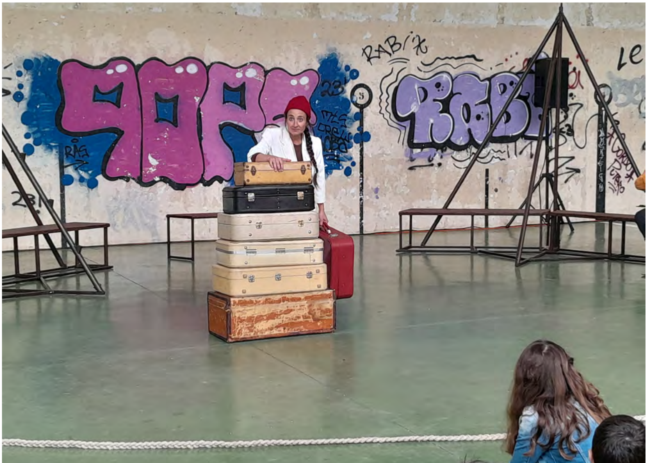
Pausa, Cia niMú

Narrazio Digitalen Laborategia egitasmoan sare sozialek, multimedia kontakizunek, ekitaldien antolaketak edota animazioen inguruko kolaborazioek aurrera egiteko