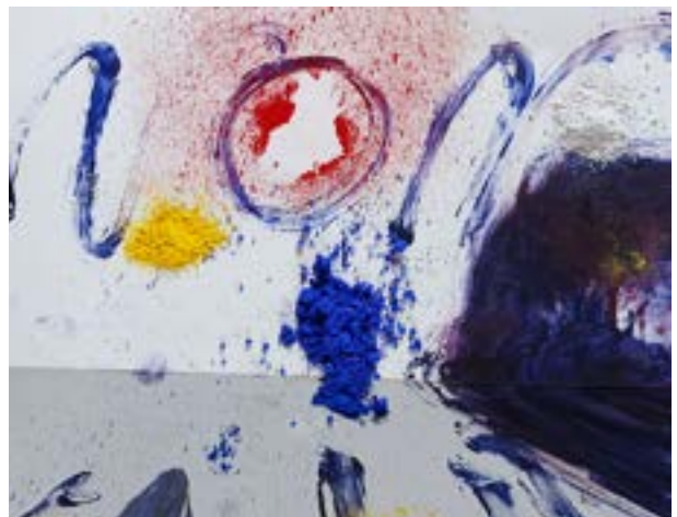
Poesia eta pentsamendua