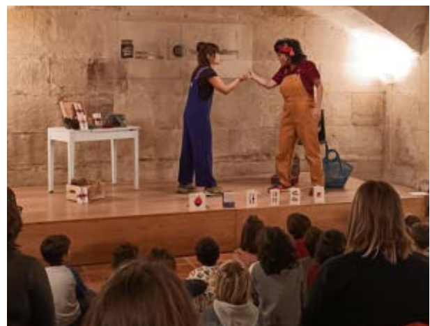
Ipuin Kontalarien VI. Maratoia