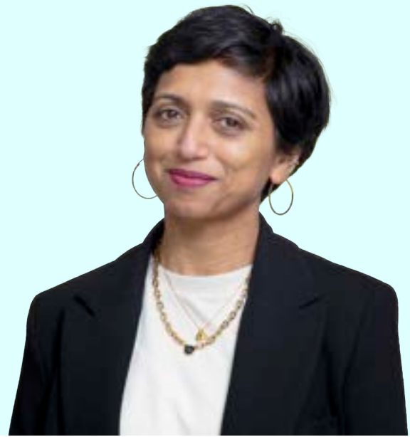
María Belmonte, Natacha Appanah