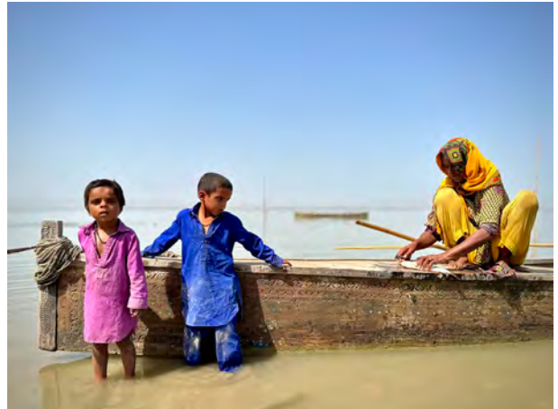
Pakistan: Indusen ibaibideak erakusketa