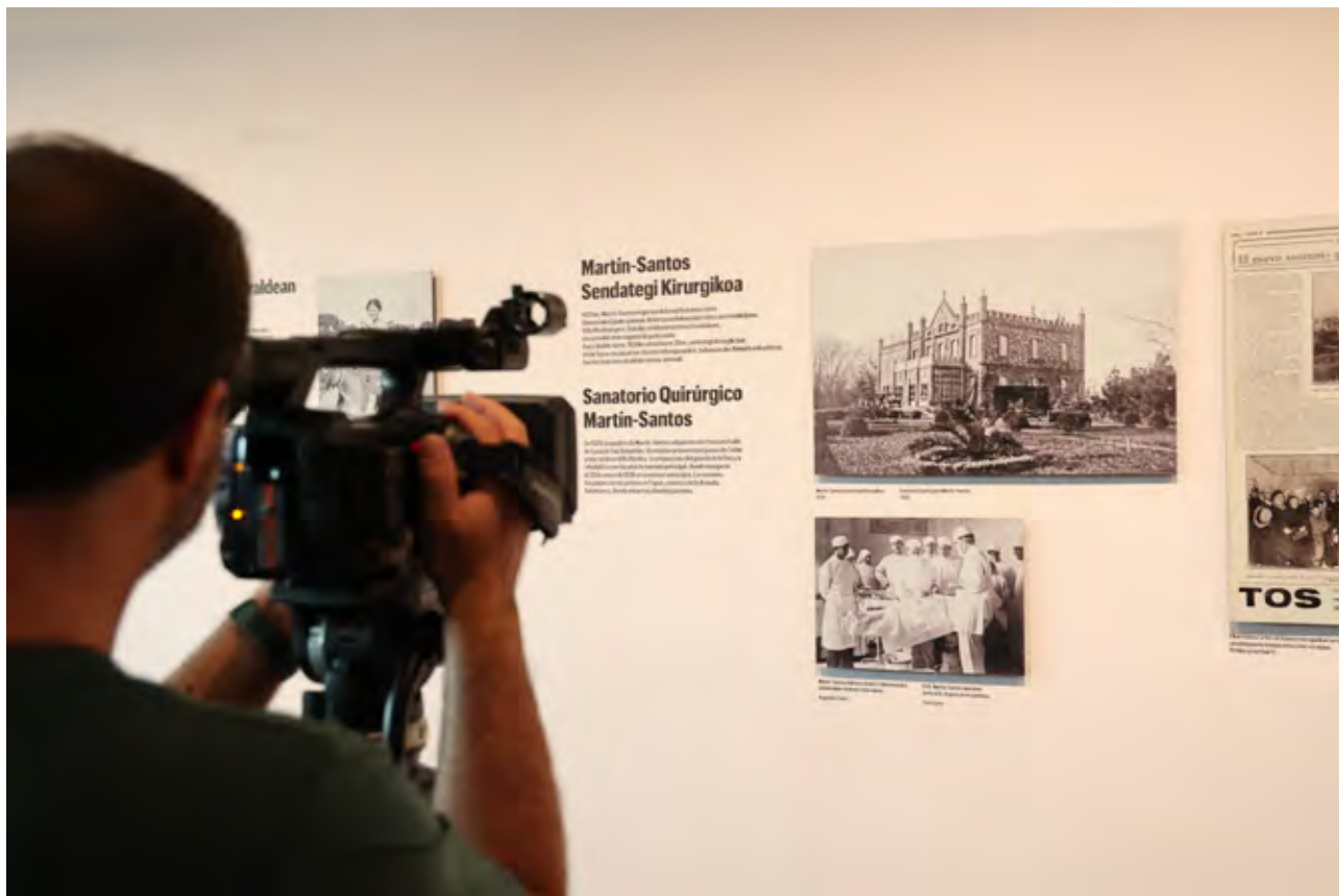
Exposición Luis Martín-Santos. Tiempo de libertad