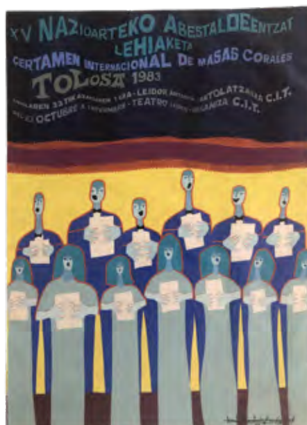
Tomás Hernández Mendizabal

En cuanto al servicio de consulta externa, se atendieron más de 80 consultas que generaron documentación y más de 50 solicitudes de reproducción de imágenes. La consulta y el servicio de documentación internos fueron especialmente exigentes a la hora de dar respuesta a las necesidades documentales de exposiciones celebradas en San Telmo con presencia de fondos propios. Igualmente, el cambio de las salas de arte vasco de la exposición permanente exigió un importante trabajo de documentación y control del movimiento de colecciones.