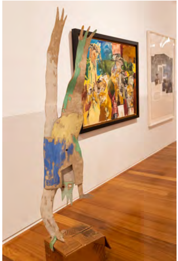
Exposición 100 años. Lo moderno y/o lo contemporáneo © Iker Azurmendi

La propuesta presentada con motivo del centenario del nacimiento de Néstor Basterretxea se presentó como un recorrido integrado en la exposición permanente, estableciendo una relación entre la muestra del museo y diversas obras del autor.