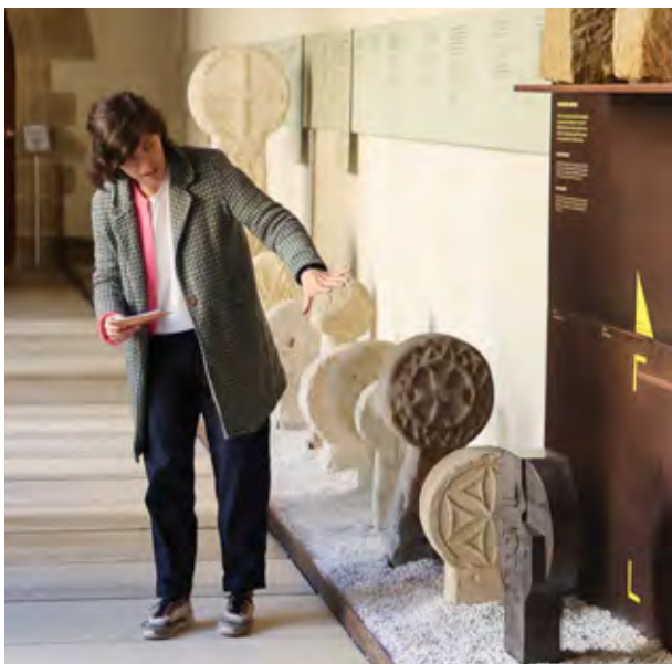
Exposición Néstor Basterretxea y San Telmo Museoa

Especial en cuanto al formato y contenido ha sido la muestra Néstor Basterretxea y San Telmo Museoa. Conexiones de una colección , comisariada por Miren Vadillo . Se trata de una intervención temporal en las salas del museo, un recorrido dialogado entre diferentes piezas de su colección permanente y una selección de obras significativas del artista vasco, aportando una mirada nueva que enriquece su conocimiento.