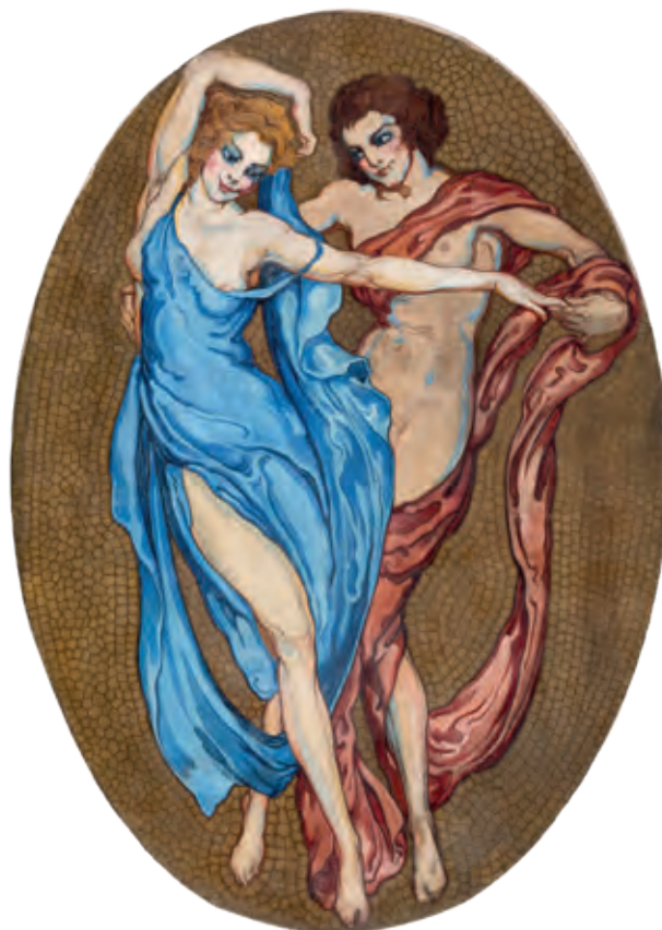
Sin título , Néstor Martín Fernández de la Torre. Obra destacada