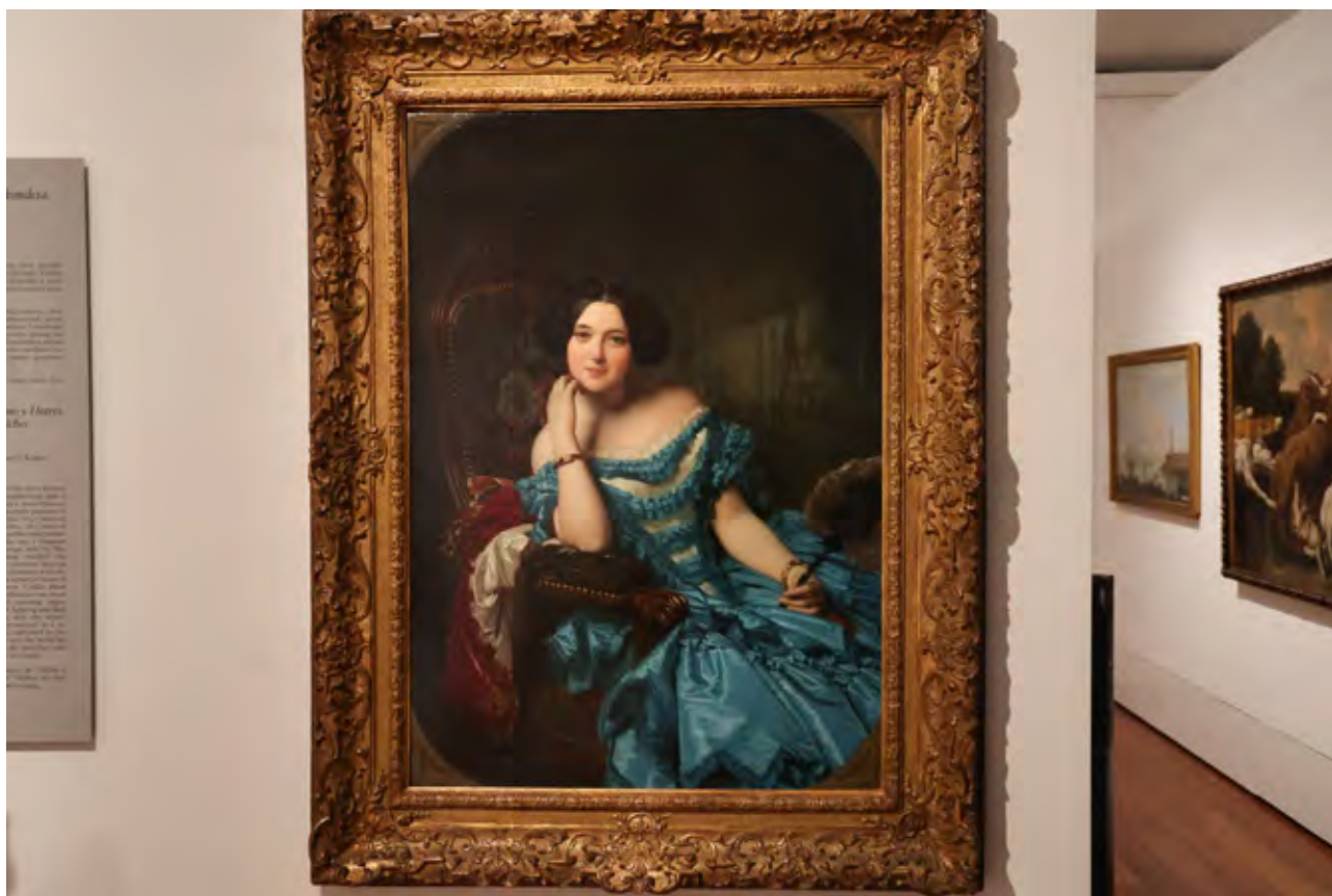
Amalia de Llano y Dotres, Condesa de Vilches, Federico de Madrazo y Kuntz. Obra destacada

El museo continuó trabajando sobre el patrimonio, por un lado, con la conservación y restauración de objetos, y por otro, con la adquisición de nuevas piezas a través de compras y de donaciones.