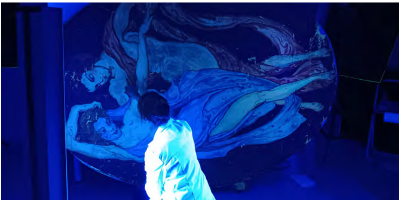
Restauración de la obra Sin título de Néstor Martín-Fernández de la Torre