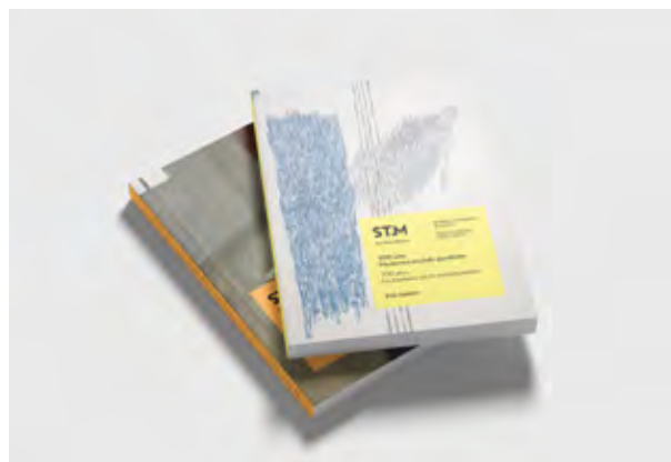
100 años. Lo moderno y / o lo contemporáneo