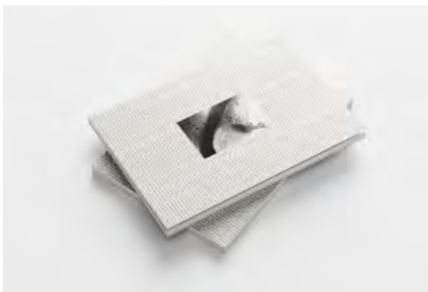
Pliegue. Xare Álvarez