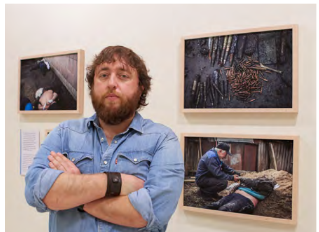
Premio Internacional Luis Valtueña