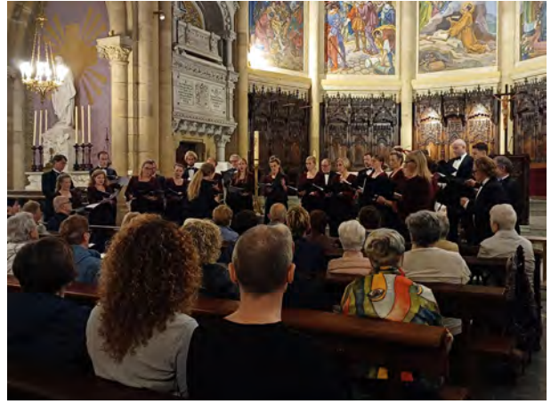
Camerata Chamber Choir, Semana de Masas Corales

La explanada de Sagües se llenó de ambiente durante el mes de junio, con dos actos multitudinarios: Musika Gela Fest y la romería de San Juan , en la que fueron protagonistas el tradicional reparto de flores, los bailes tradicionales vascos y la romería del grupo Iratzar . A pesar de que se había anunciado mal tiempo, no supuso ningún inconveniente para que los vecinos y las vecinas disfrutaran de la magia de la fogata de San Juan. Sagües volvió a ser el escenario perfecto para la música, la cultura y la comunidad. Mientras tanto, de la mano de los servicios Haurtxoko y Gazteleku, se celebró la fiesta del Solsticio de Verano en la plaza Catalunya.