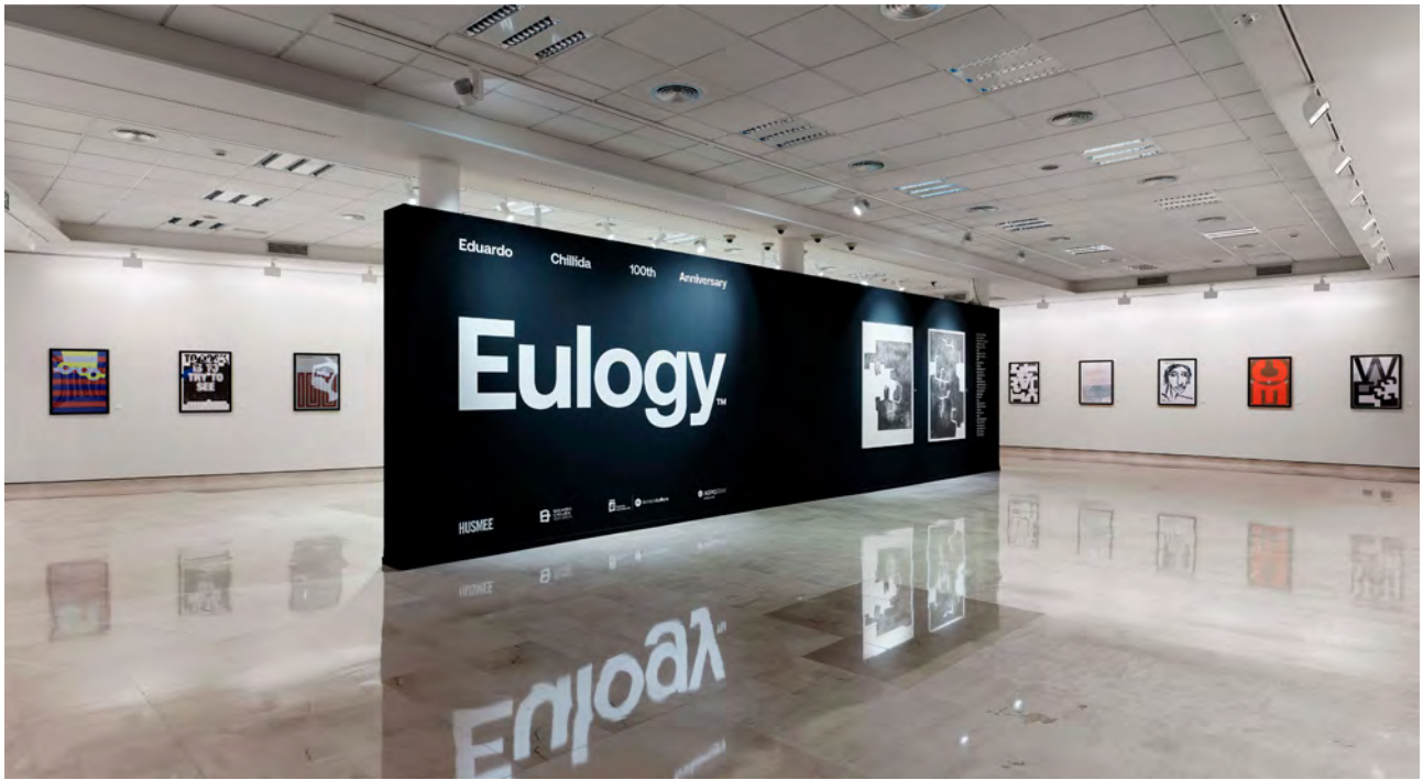
Exposición Eulogy Chillida 100 urte