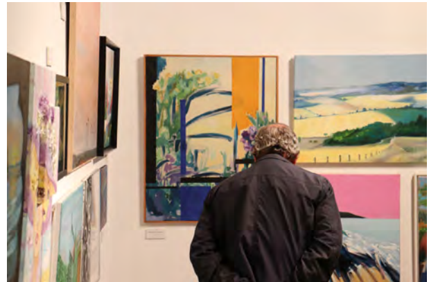
Exposición III. Certamen de Pintura Pilar Gracia