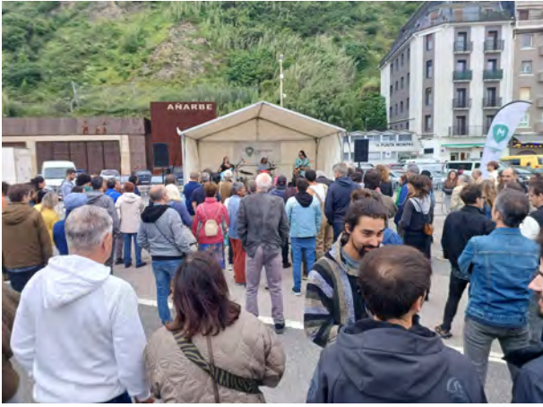
Musika Gela Fest, Sagües