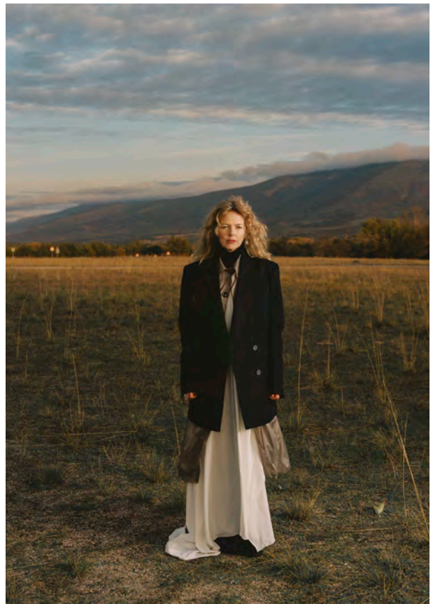
Christina Rosenvinge