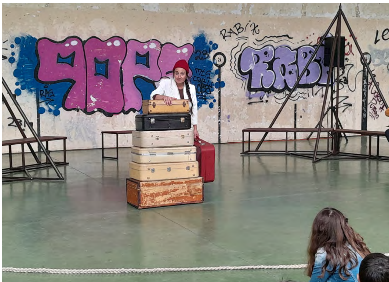
Pausa, Cia niMú

Tras estas innovaciones, una de las características del año 2024 fue el esfuerzo realizado para el acercamiento a otras tecnologías y lenguajes más cercanos al público joven, además de continuar con los formatos audiovisuales más habituales (documentales, cortometrajes, etc.). Dentro del proyecto del Laboratorio de Narrativas Digitales , se encontró un espacio para la colaboración,