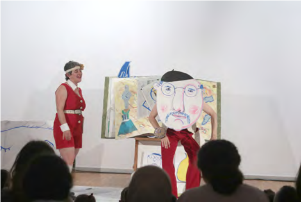
Boli, bili, boli, Pantzart