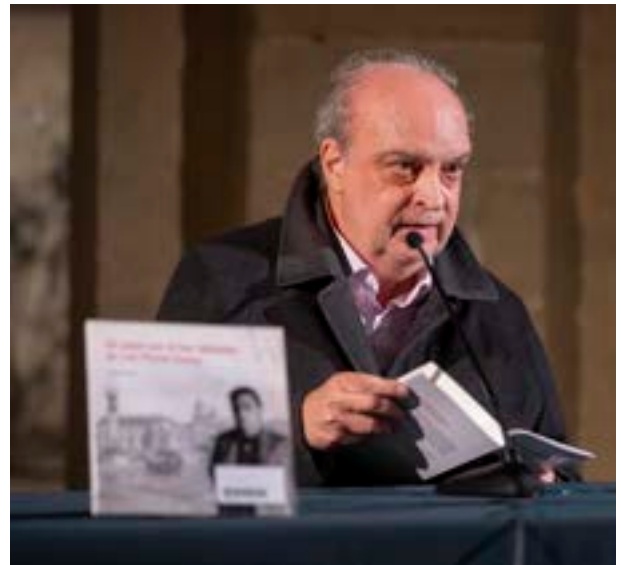
Enrique Vila-Matas, Literaktum