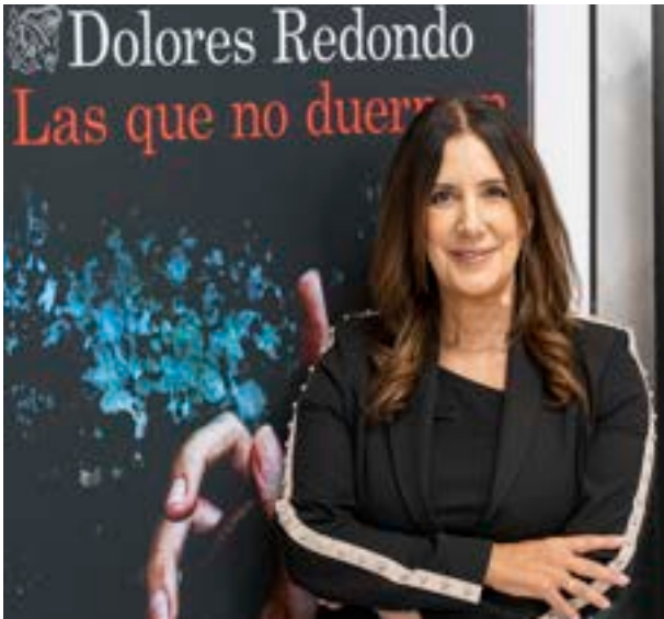
Dolores Redondo, Literaktum