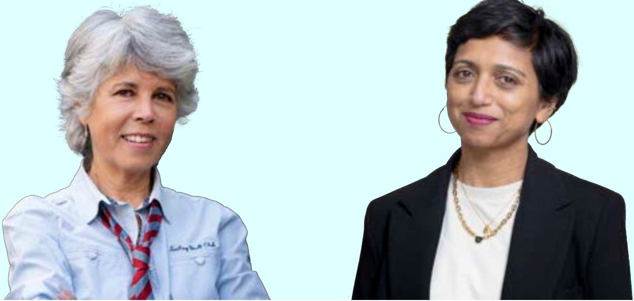
María Belmonte, Natacha Appanah