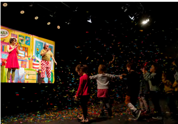
Misterioa, Tomaxen abenturak