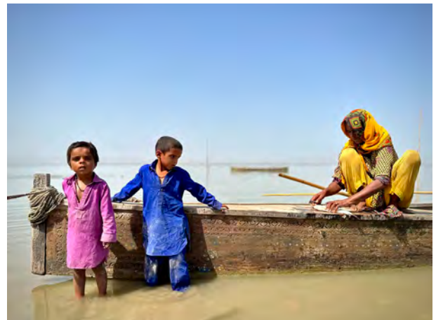
Exposición Pakistán: los cauces del Indus

Organizada por Afundación - Obra Social ABANCA y comisariada por Asier Mensuro , la muestra ofreció una reinterpretación de la iconografía fantástica de Goya a través de la visión del reconocido artista francés Stéphane Levallois . La exposición exploró la fascinante conexión entre los monstruos del siglo XIX y los del Hollywood contemporáneo, representados por Hellboy, el icónico personaje de cómic concebido por Mike Mignola .