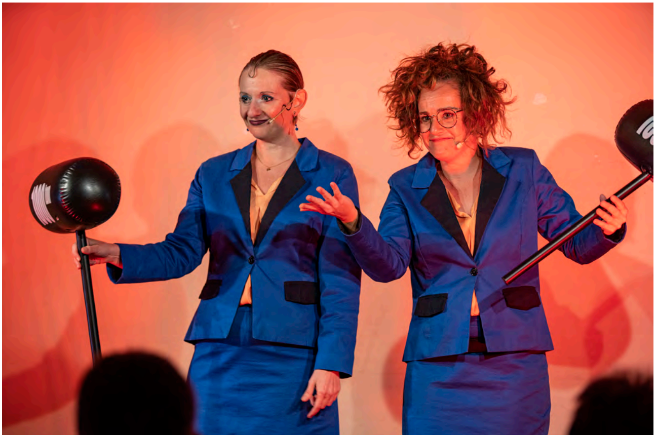
Las Couchers, Centro Extremeño © Iñaki Rubio