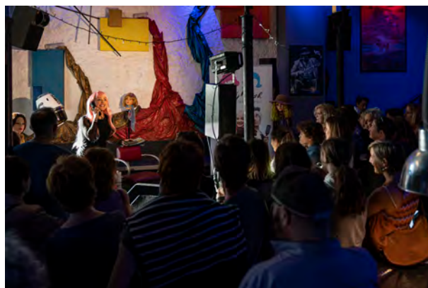
Kris eta Krash, Scanner

Las compañías mostraron su agradecimiento tanto a Donostia Kultura como al público. Al primero, por continuar apostando por el sector y el festival en la coyuntura actual, y al segundo, por volver a asistir con ilusión a sus espectáculos. Poltsiko Antzerkia cuenta con un público fiel que cada edición vuelve a reencontrarse en este festival ya clásico de la programación cultural donostiarra.