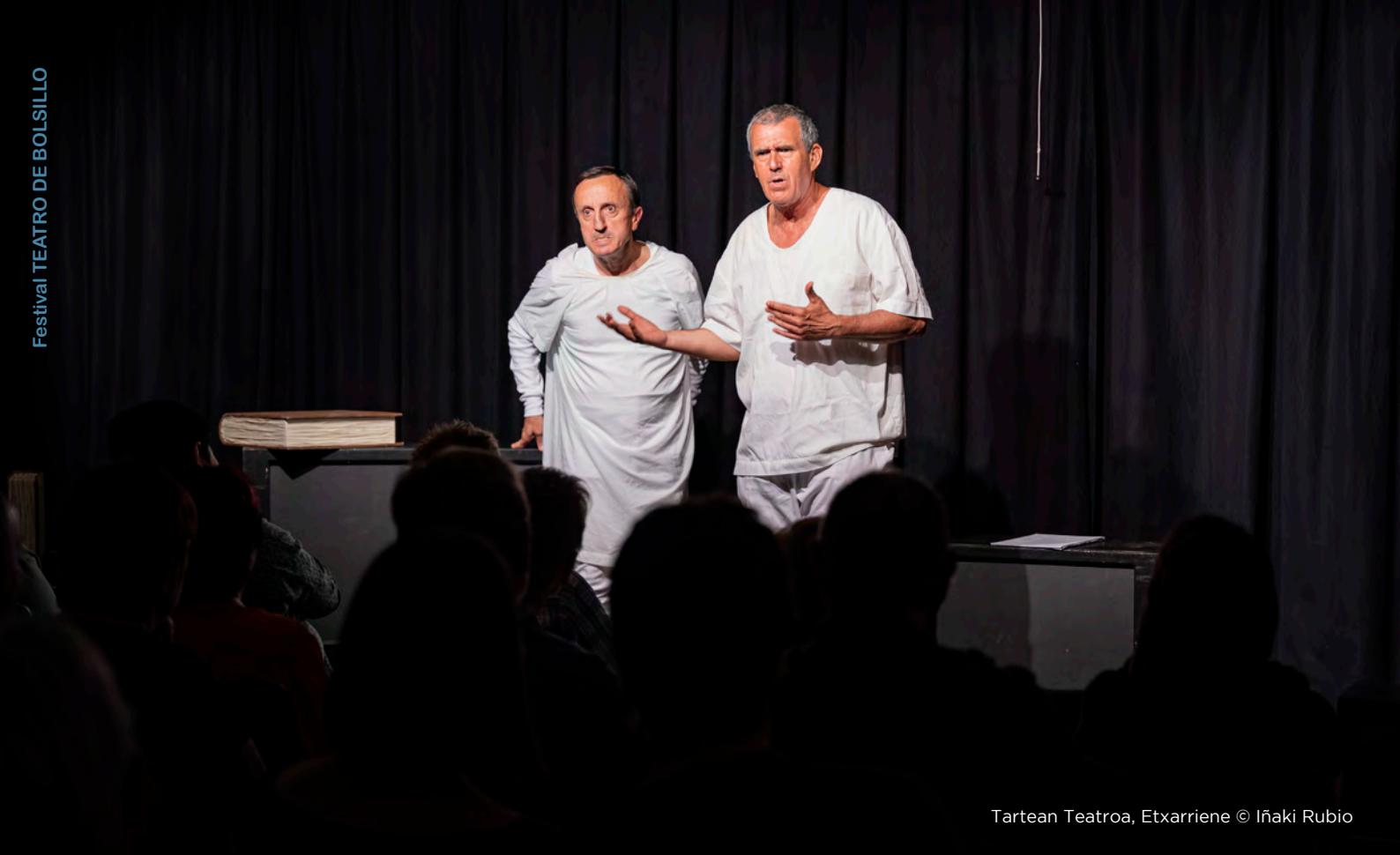
Tartean Teatroa, Etxarriene