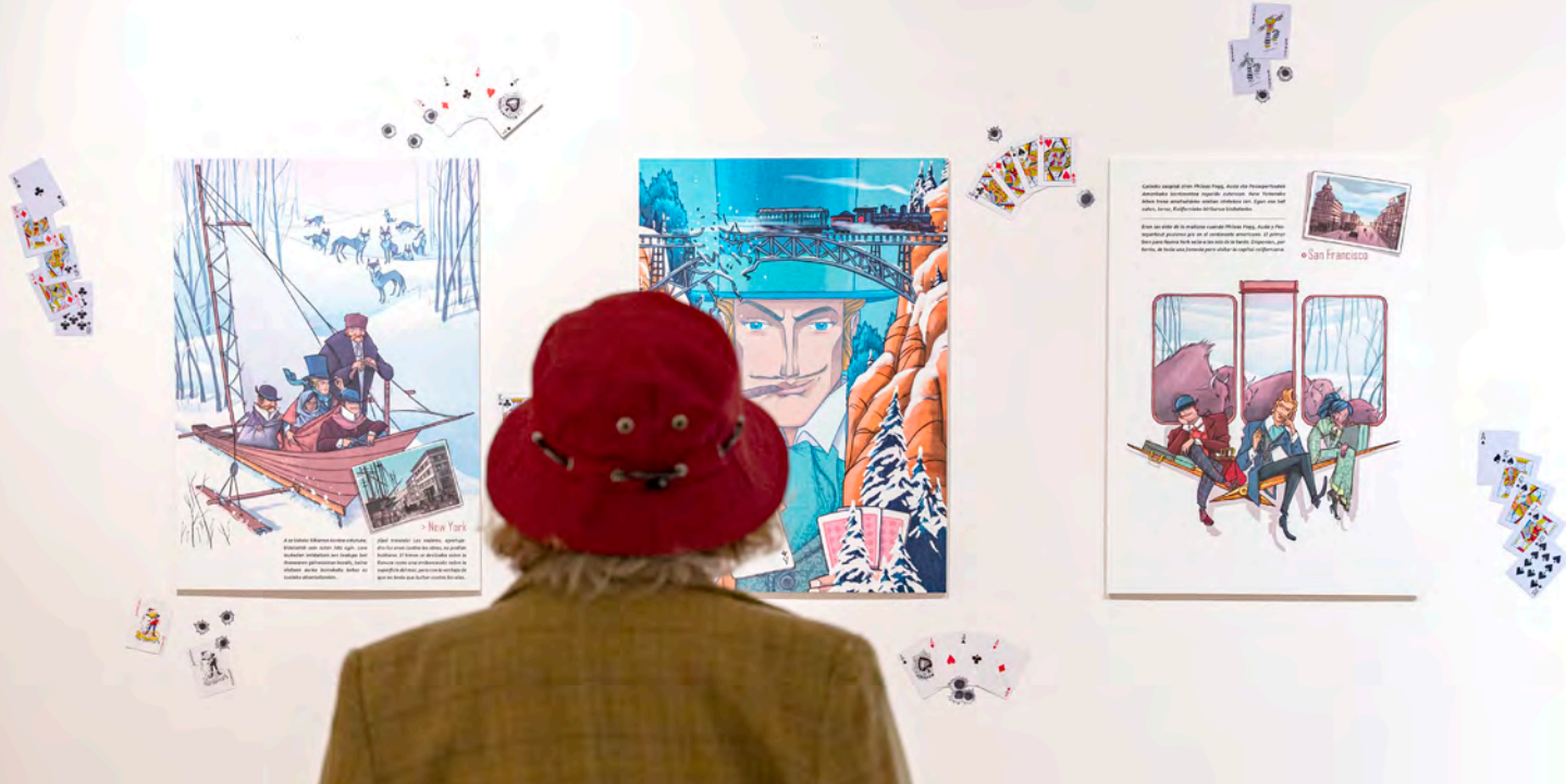
Erakusketa La vuelta al mundo en 80 días

Las novedades literarias también tuvieron su espacio en el festival de las letras, en este caso de la mano de Gioconda Belli , Patxi Zubizarreta , y la autora germana, Antje Rávic Strubel .