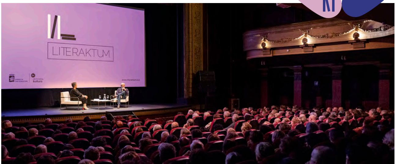
Antonio Muñoz Molina

Literaktum también contó con dos citas de Literaktum Topaketak , fuera de las fechas del festival en Okendo Kultur Etxea: la primera fue el 26 de abril con la conocida escritora estadounidense Jhumpa Lahiri , y la segunda el 29 de septiembre, con la Premio Nobel de Literatura de 2018 Olga Tokarczuk .