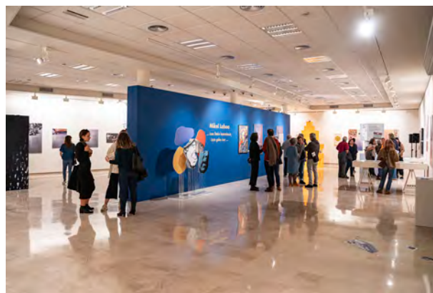
Mikel Laboa