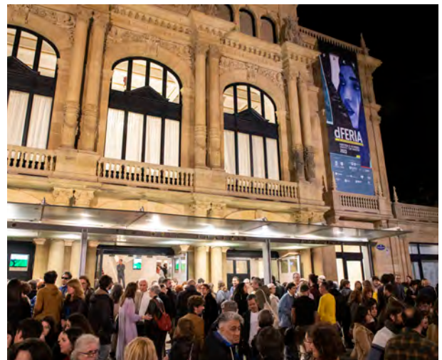
dFERIA ambiente

dFERIA fue contemporánea, innovadora, comprometida, variada y novedosa. La Feria de San Sebastián apostó firmemente por la calidad como una de sus principales señas de identidad. Calidad en las propuestas artísticas y en sus teatros, así como en los servicios ofrecidos a los profesionales. Cada año dFERIA elige un eje temático que se convierte en un aliciente más de la propia feria. Las actividades paralelas, el foro de negocios, referente en el resto del Estado, las presentaciones privadas y públicas dotaron de herramientas de trabajo muy valiosas a artistas y gestores. Las mesas de reflexión, formadas por intelectuales, se convirtieron en una aportación muy importante que ayudó a pararse, reflexionar, sacar conclusiones, corregir y dibujar caminos de mejora continuada hacia el futuro.