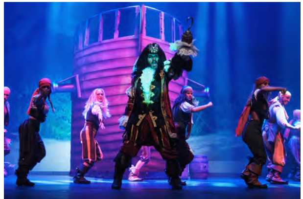
Peter pan, el musical