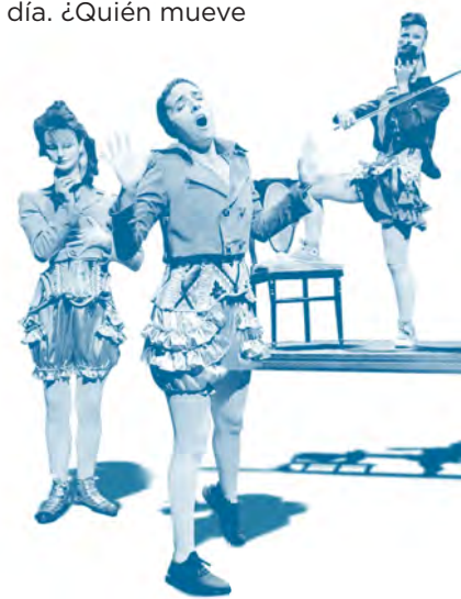
Hiru kortse, azukre asko eta brandy gehiegi

Esta fiesta tuvo su colofón final con la gala de entrega del premio celebrada el día 27 de marzo, Día Mundial del Teatro. Donostia consiguió mantener y sustentar, gracias al apoyo de un público cada vez más numeroso, una programación estable y regular, única en Euskadi, de teatro en euskera para un público joven y adulto.