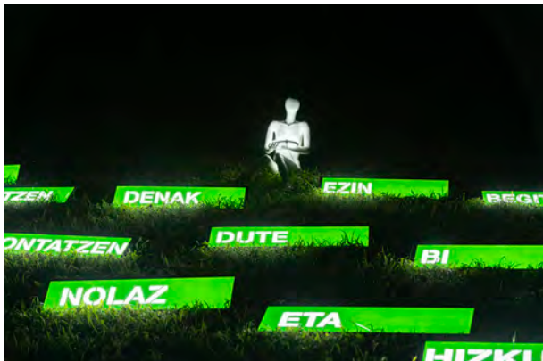
Begiekin pizteko hitzak

El sábado arrancó con la propuesta del grupo Lumi acompañado de las fotografías de Nagore Legarreta donde se mezclaron con el sonido electrónico de melancolías especiales. Continuó con el concierto del grupo catalán TMATMB y las proyecciones hipnóticas de Desilence . El festival llegó a su fin con Pablo Casares , artista y creador polifacético, que presentó un gran trabajo como broche final.