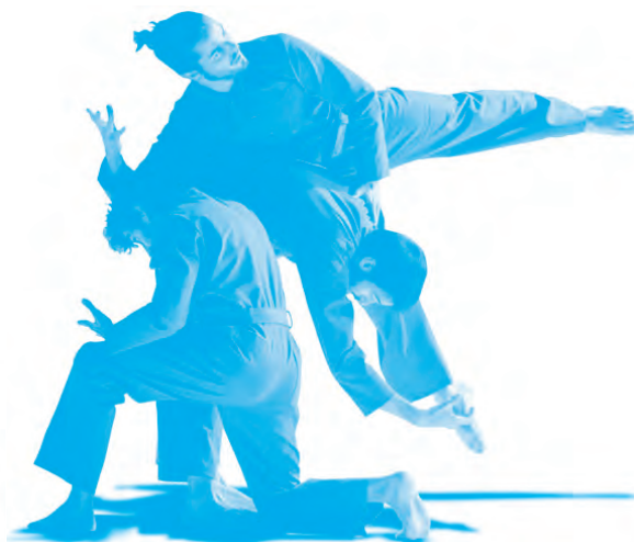
La Noche de San Juan, Compañía Antonio Ruz