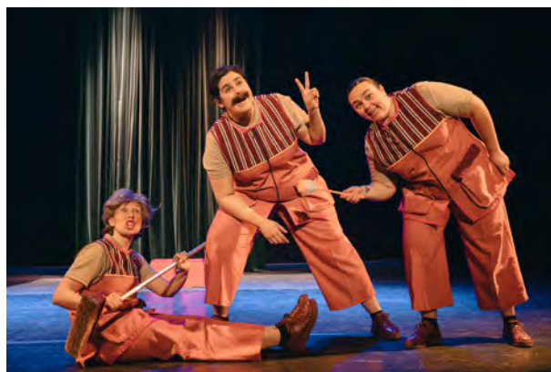
Las que limpian, A panaderia

Emankizunak bikainak izan ziren, eta donostiarrek harrera ona egin zieten.