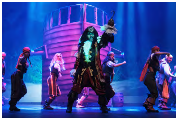
Peter pan, el musical