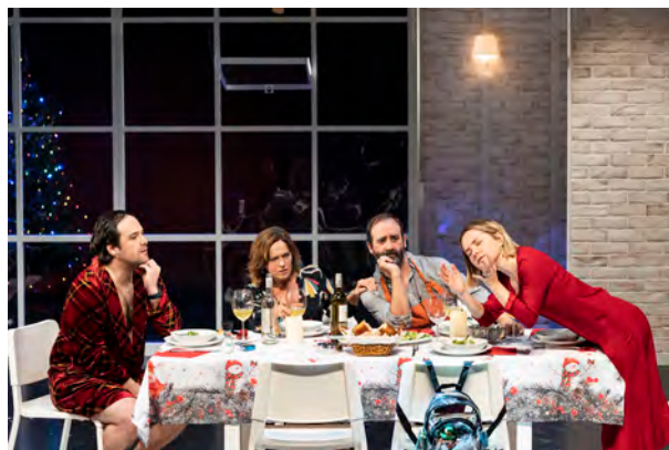
Ez naiz inoiz Dublinen egon