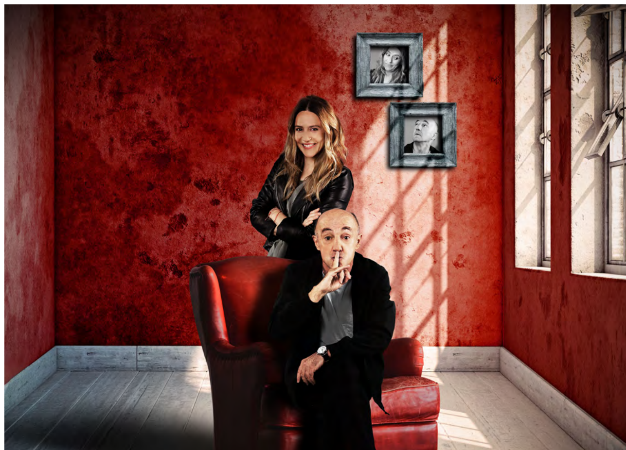
Hobe ixilik , Itziar Ituño & Ramon Agirre