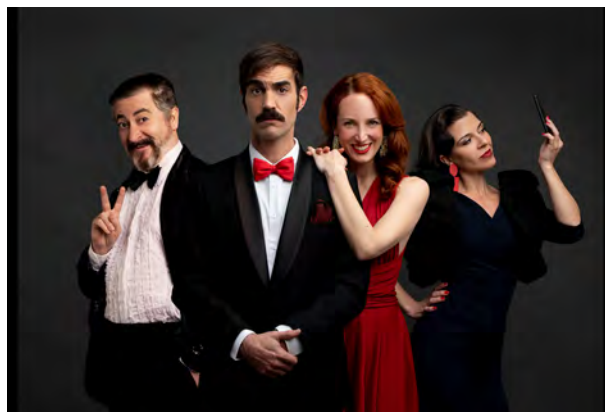
Un oscar para Óscar