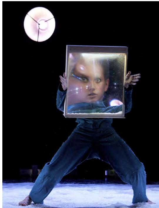
Leihoak, Teatro Paraíso

Lau urtetik aurrera, Ponten Pie konpainiaren Bajau . Gizakion lehen zelula urez beteriko mintz batean garatzen da.