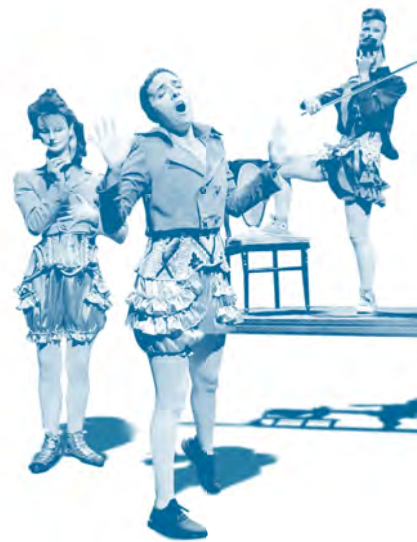
Hiru kortse, azukre asko eta brandy gehiegi

Festa amaitzeko, martxoaren 27an, Antzerkiaren Munduko Egunean, saria emateko jaialdia egin zen. Donostiak, gero eta ikusle gehiagoren babesari esker, Euskadin parerik ez duen gazte eta helduentzako euskarazko antzerki-programazio egonkor eta erregularri eusten dio.