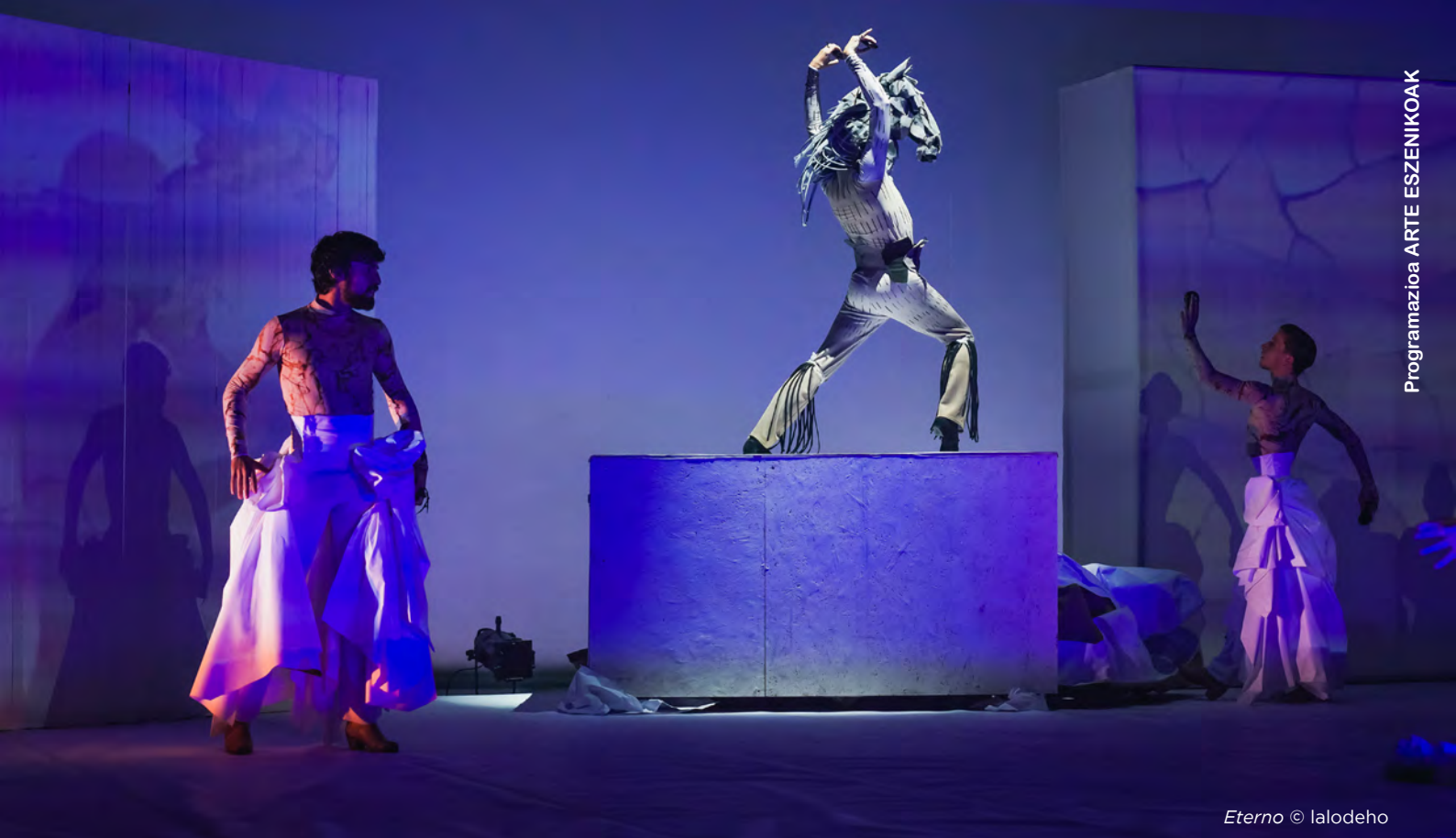
Eterno