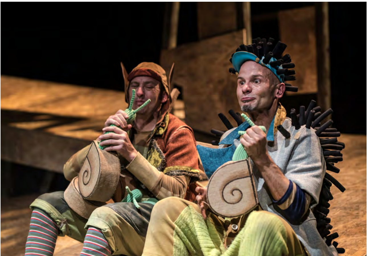
La fábula de la ardilla, La Baldufa

Jaialdien arloan, berriz, esan behar da harrera oso ona izan zutela Poltsiko Antzerkiak zein dFeria edo Gazteen Antzerki Topaketen egitarauen barruan eskainitako antzezlanek.