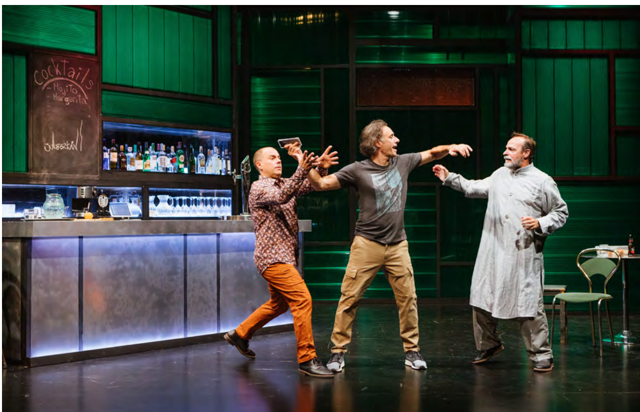
Muchos amigos negros, Ados Teatroa

Haurren eta familien atalak ere igoera handia izan zuen publikoari dagokionez, saioetara joan zen jende kopuruak erakusten duen bezala. Kasu honetan, konpainia gehienak izan ziren bertakoak ( Mar Mar, Gorakada, Ganso & Cia... ), baina urrutiagoko beste batzuk ere izan genituen ( La Baldufa, Princep Totilau ), eta benetan gozarazi zieten ikusleei.