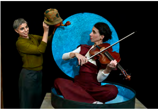
Kelonia eta itsasoa, Gorakada