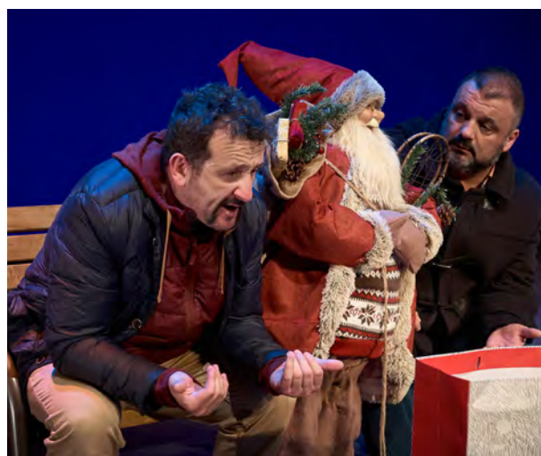
Porno , La Roca Producciones

Antzerki-programazioari dagokionez, benetan nabarmen igo zen ikusle kopurua. Antzezlanen izaera heterogeneoa kontuan hartuta, harrigarria izan zen publikoak emandako erantzuna.