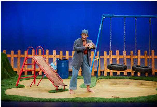
Muna, Ganso & Cia

Gauza bera esan daiteke konpainia amateuragoek eskainitako antzezlanen inguruan. Arrakasta handia izan zuten tokiko antzerki-taldeek, eta txalo-zaparradak jaso zituzten haien antzezlanek ( Nueve Teatro, Emakume Ausartak, Pixcolabis, Les Figuretes... ).