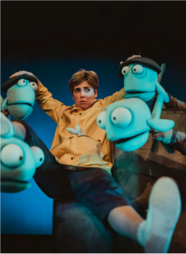
Arrainak bihotzean, Mar Mar Teatroa