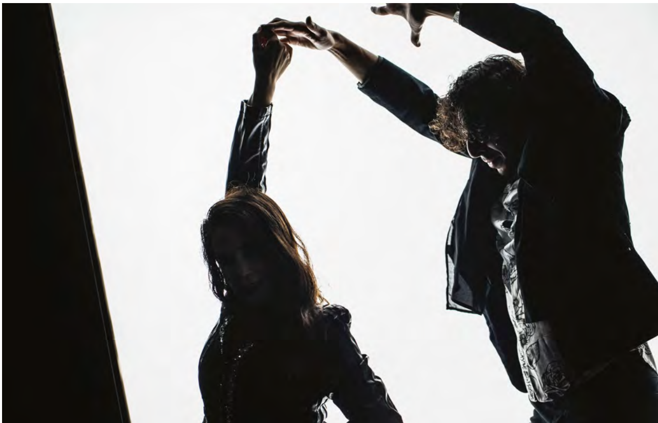
Flamenca de Sal