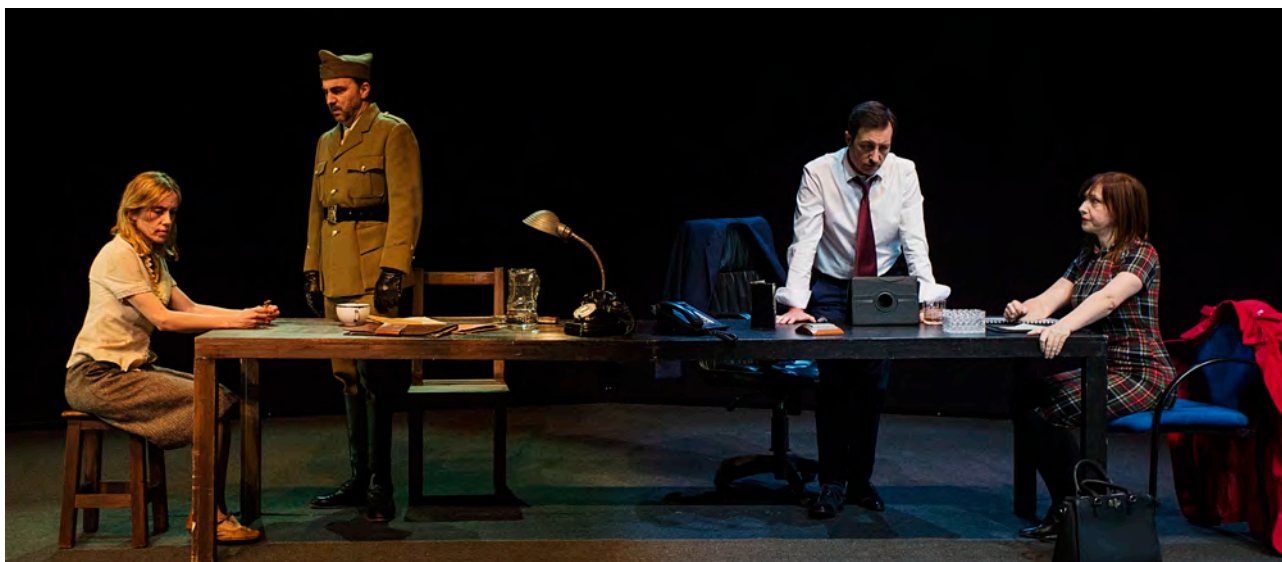
La invasión de los bárbaros, Arden Teatroa

Hainbat konpainia eta antzezlan azpimarra daitezke, baina harrigarrietako batzuk aipatzearren, nabarmentzekoak dira, besteak beste, La Roca Producciones, A Panadaría, Ados Teatroa eta Arden Teatro .