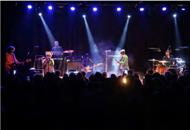
El columpio asesino, Dkluba