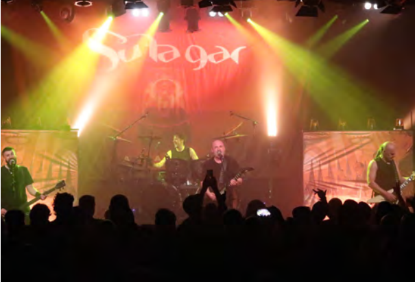
Su Ta Gar, Dkluba