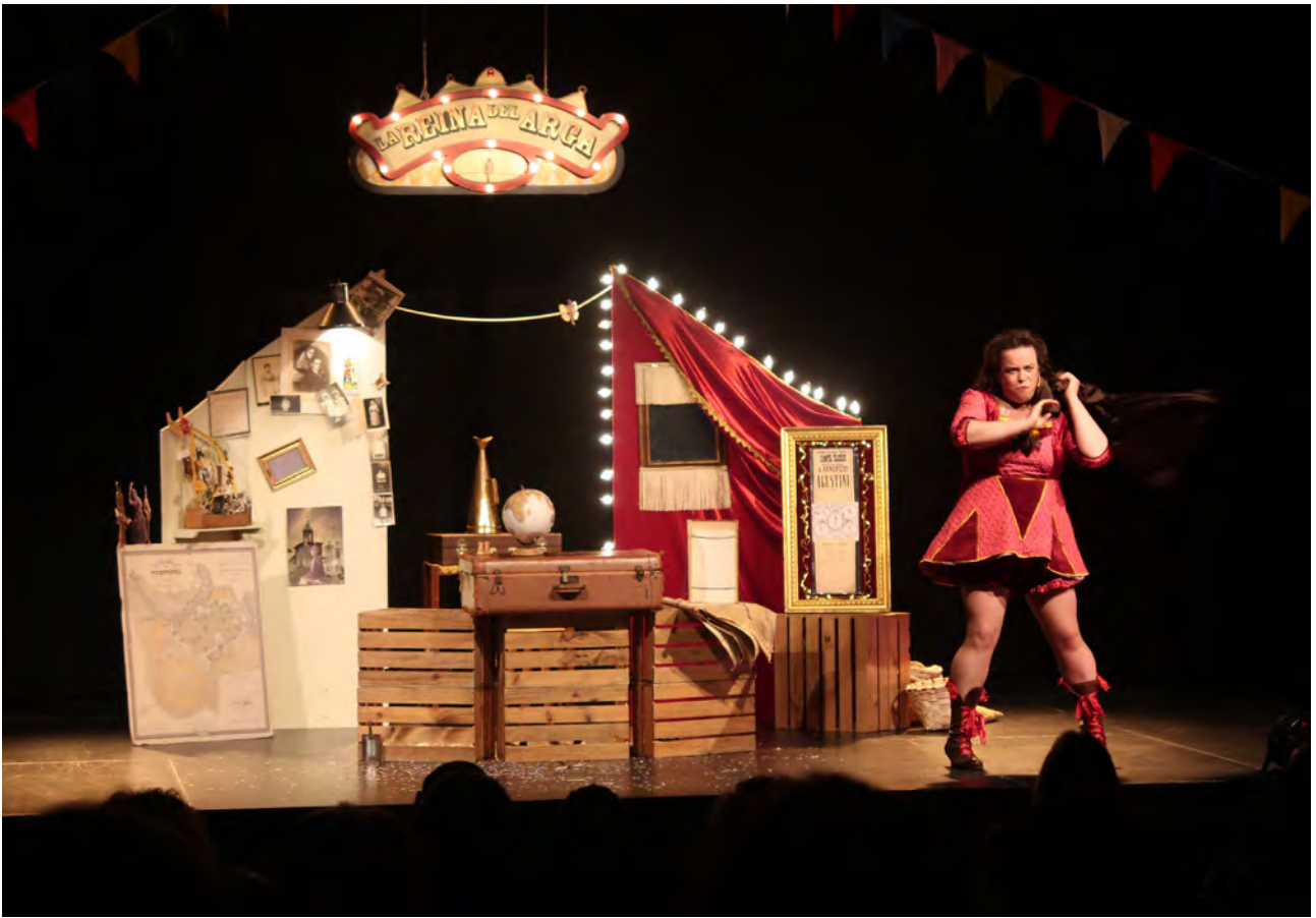
La Reina de Arga , Quiero Teatro, Emakumeen Astea

Intxaurrenondo Kultur Etxeak auzoan sinergiak sortzeko duen estrategia funtsezko zutabea izan zen. Auzoko bizilagun, erakunde eta ikastetxeentzako, elkartzeko eta ekimenak garatzeko espazio bihurtu zen. Udaleko beste sail batzuekin lankidetzan ere jardun zuen kultur etxeak, hala nola Gazteria eta Gizarte Ongizate sailekin eta Donostiako Udalaren Musika eta Dantza Eskolarekin, programa eta ekintzetarako espazioak eskainita.