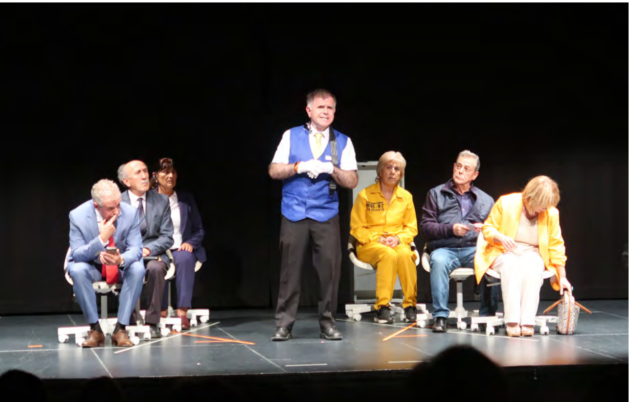
Turbulencias , Nueve Teatro, Extremaduraren Astea

Hiriko kultur etheen sareko kide den aldetik, sarearen programetan modu aktiboan lagundu zuen Intxaurrondo Kultur Etxeak, eta komunitatean funtsezko kultura-espazio parte-hartzaile gisa duen eginkizuna finkatzen jarraitu zuen.