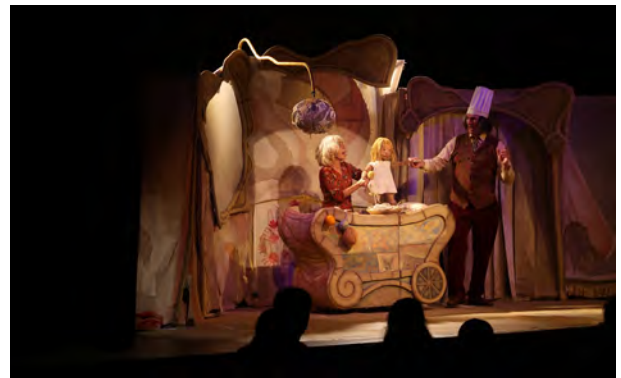
Noa, uy, uy, uy , Pantha Rei, Emakumeen Astea

Emakumeen Asteak errotuta jarraitzen du Intxaurrenondo Kultur Etxean, auzoko elkarteekin lankidetzan. Emakumeak eta Zientzia gaiaren ingurukoa izan zen 2023ko edizioa, eta hainbat jarduera egin zen: Bertso Literarioa , Radio Rebel taldearen kontzertua, La Buena Esposa filmaren proiektzioa, La Reina de Arga antzezlanaren eta Noa, uy, uy, uy izenburuko familientzako antzerki-emanaldia, besteak beste.