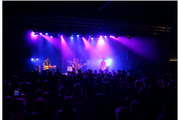
Kutixik Jaialdia, Dkluba

Dkluba programako jardueren artean, martxoko eta apirilko ekitaldiak nabarmendu ziren; martxoan, Goxuan Salsa taldearen emanaldia izan genuen, eta Quitapenas Colectiva izan zen talde gonbidatua. Apirilean, berriz, erabat bete zen aretoa, Su Ta Gar taldearekin. Maiatzean, bestalde, arrakastatsuak izan ziren Corizonas eta Ibil Bedi taldeen kontzertuak eta, irailean, sarrerak agortu egin ziren berriz ere, El Columpio Asesino taldearen kontzerturako.