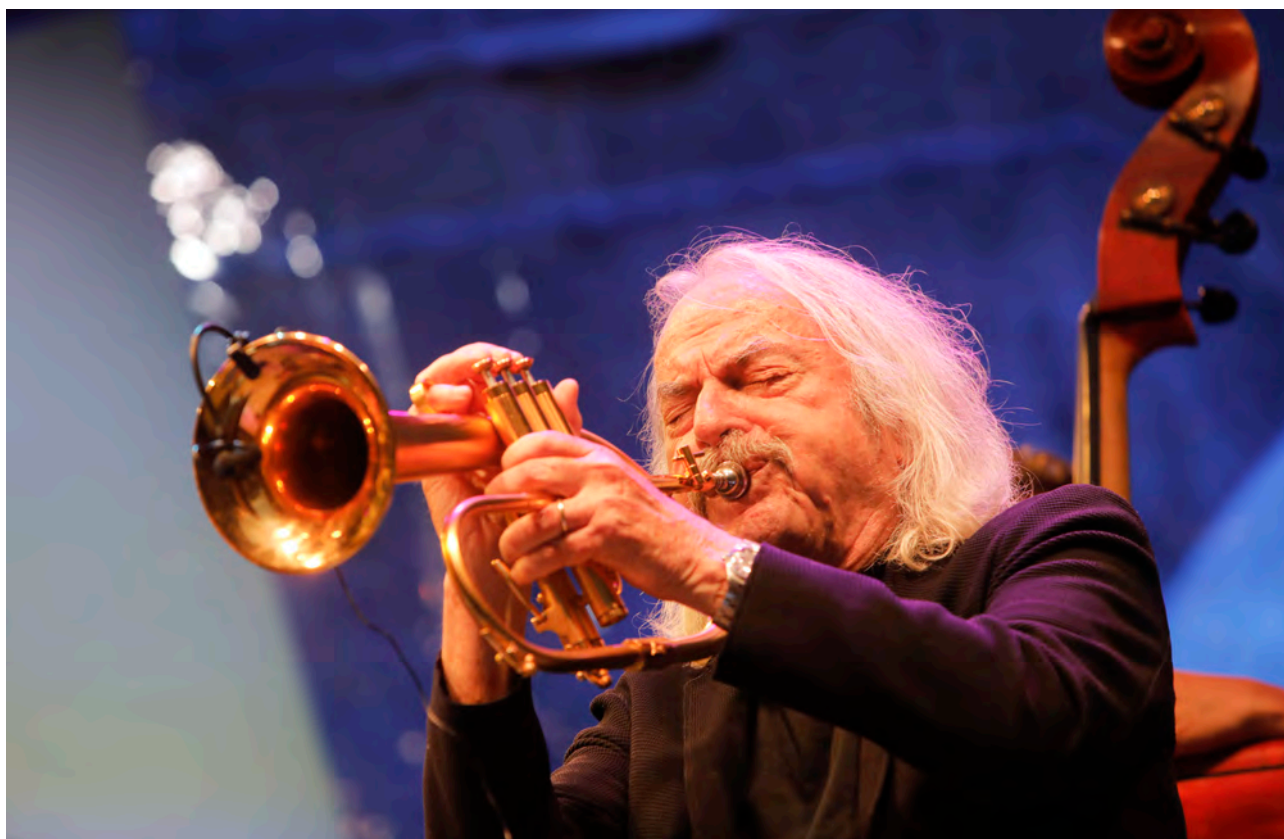
Enrico Rava Fearless Five