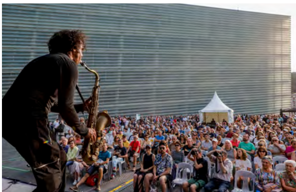
Ill Considered

Estilo eta jatorri ezberdineko taldeez gozatzeko aukera egon zen jendez gainezka zeuden terraza horietan. Jazzaldirako Tokiko Taldeen Hautaketa-prozesuaren eta Katapulta Tour ekimenaren bitartez aukeratutako euskal taldeez gozatzeko aukera ere egon zen, eta argi gelditu zen une bikaina bizi izaten ari dela euskal jazz: Xahu, Isla Trio, Motelas, Arnaud Labastie Trio, Les Cuisinieres, Lutfi Jakfar's Sith Trio, Bamms, Amaika Rude, Mikel Legasa's Quintet, Xavi Maldonado & David Cid Cuartet, Kinkfols eta Olana Liss aritu ziren, hain zuzen ere. Izen handiko eta ibilbide bikaineko nazioarteko artistak ere izan genituen, hala nola: Damir Imamović, The Side Effects, Ill Considered, Jerry Bergonzi, The Mississippians, Sara Dowling, Pacific Jazz Ambassadors, Conversessions eta Bengue .