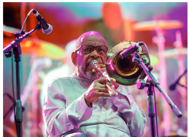
Fred Wesley & the New JBS

Jazzaldiak asko eskertzen eta baloratzen du jendearen erantzuna; izan ere, uztailaren 24an eta 25ean, euria egin zuen arren, musika-eremu guztiak betetzeaz gain, 2023an ere, jokaera eredugarria izan baitzuten entzuleek, inolako arazorik eragin gabe. Hiria berriro ikusi genuen musikaz, jai-giroz eta ospakizunez gainezka.