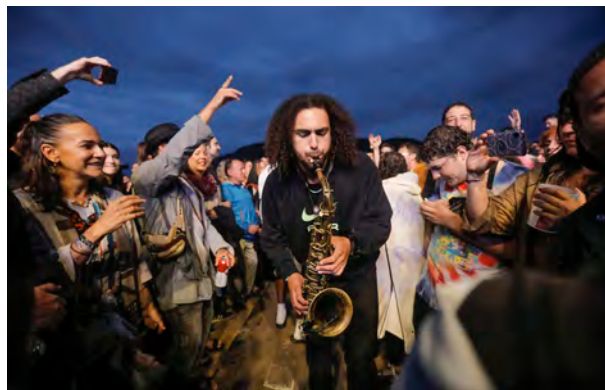
Ezra Collective

Askotariko estiloak entzun ahal izan ziren Keler Guneako 8 kontzertu jendetsuetan. Uztailaren 21ean, 40.000 lagun jarri zituen dantzan hondartzan Village People taldeak; ondoren, Fred Wesley handiaren txanda izan zen, funkaren historiako izen handienetako batena. Blue Lab Beats izan genituen hilaren 22an; freskoak, esperimentalak eta oso atseginak. Erabat eurenganatu zuten publikoa. Jarraian, Keler Gunea joan ziren Viva Suecia taldearen milaka jarraitzaileek haien abesti guztiak kantatu eta dantzatu zituzten, lehenengo notatik hasi eta azkeneko notaraino. Arde Bogotá taldeak energia, karra eta biribiltasuna erakutsi zuen barra-barra hilaren 23an. Tiken Jah Fakoly taldearen txanda izan zen ondoren, eta haien reggae aldarrikatzailearekin eta duten talde handiarekin, giro bikaina sortu zuten hitzordura hutsik egin ez zuten 16.000 zaleen artean. Ezra Collective -ek eskaini zuen uztailaren 24ko lehenengo kontzertua; sasoi betean dago taldea eta, zalantzarik gabe, gaur egun unerik onenean dauden Jazz taldeetako bat da. Euria egin zuen arren, dantzan jarri zituzten zaparrada azpian han jarraitzen zuten 5.000 zaleak. ZETAK taldeak eman zuen Keler Guneako 2023ko edizioko azkeneko kontzertua; 8.000 lagun elkartu zituen, denak taldearen abesti guztiak abesten eta koruak egiten.