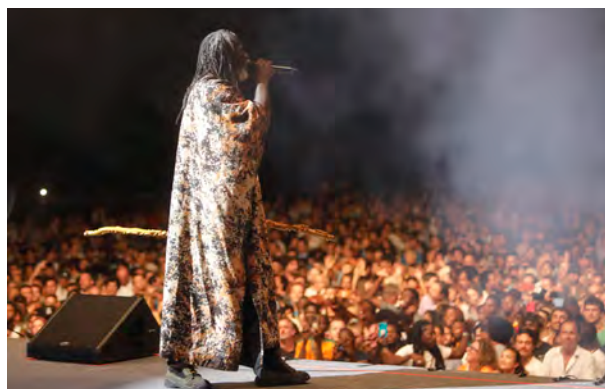
Tiken Jah Fakoly