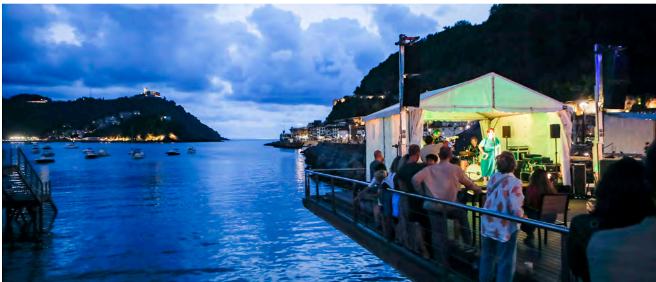
Arima Soul