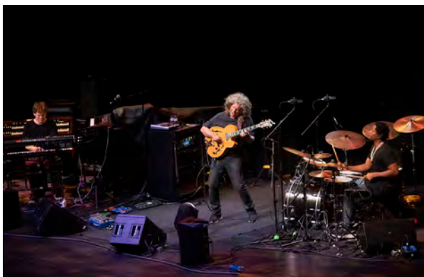
Pat Metheny