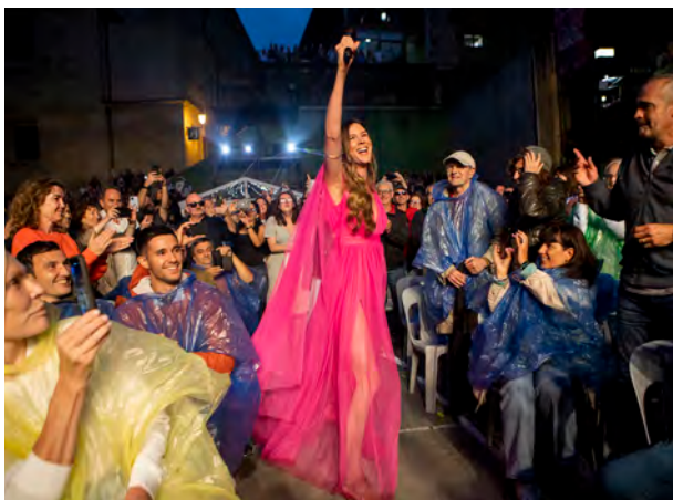
Joss Stone