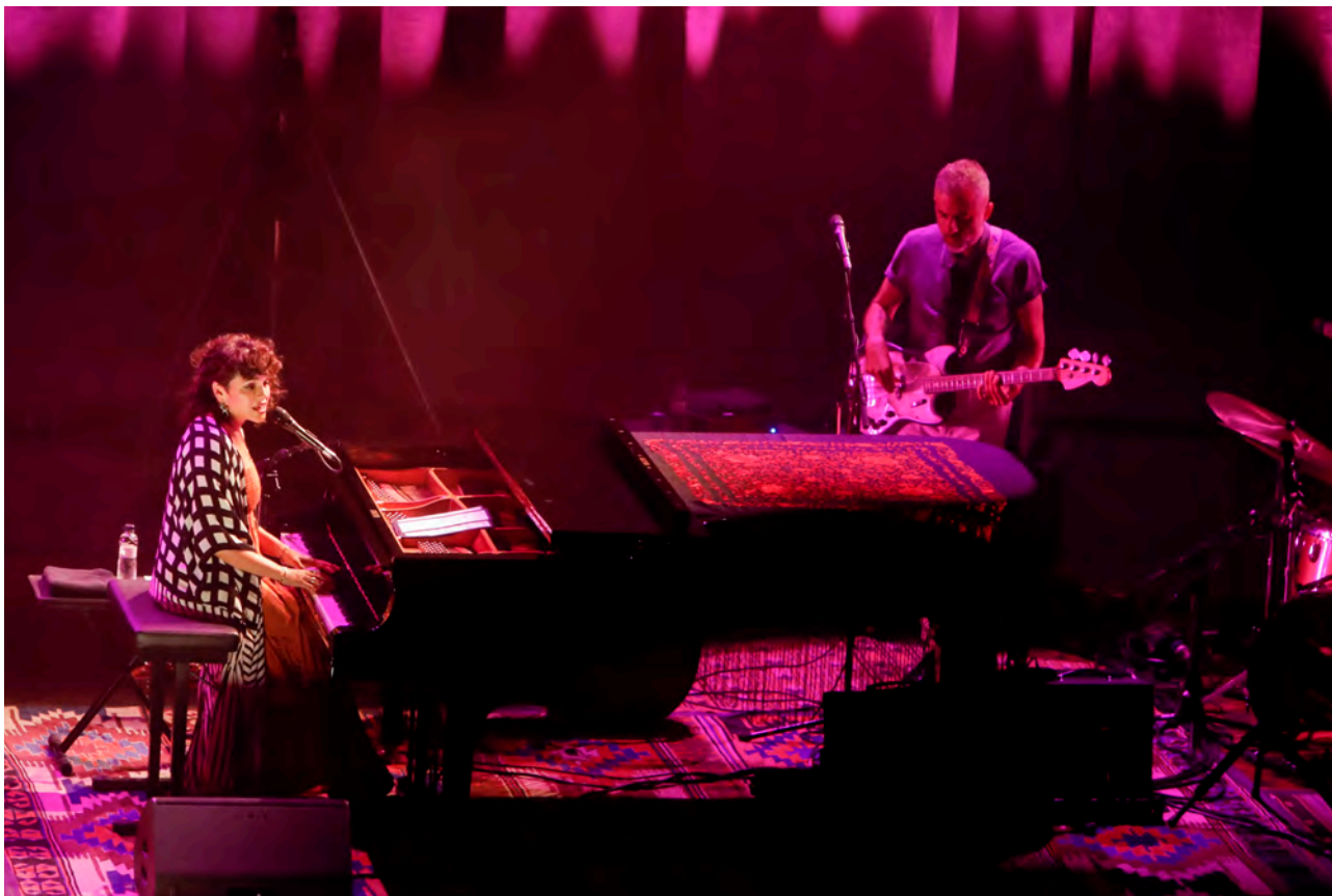
Norah Jones