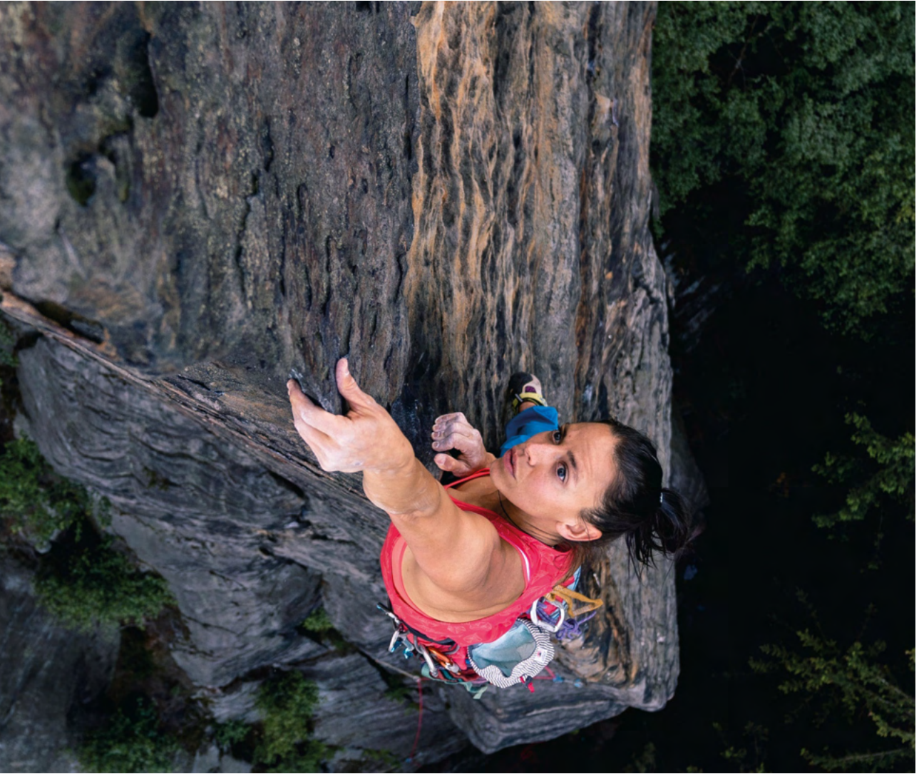
Menditour 2022 - The Edge of Guillotine

Aurten Donostia Kulturak subentzionatutako zinemaldien artean, gure aretoetan egin ziren, osorik edo partez, Dock of the Bay XVI (maiatzean), film laburrei eskainitako Donoskino VI (urrian), eta Itsaspeko 46. Zinemaldia (azaroan).