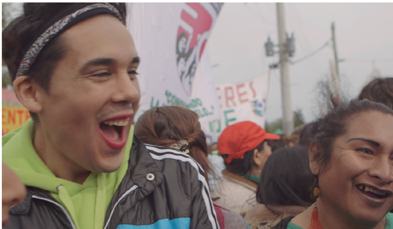
Zinegoak 2022 - Nos corps sont vos champs de bataille

Antzoki Zaharrak hainbat eratako gala ikus-entzunezko eta sozialak hartu zituen: Larrotxene Kultur Etxearen ikasturte-amaiera gure Bideoaldia rekin, AGISAS gala Bideak Zabalduz proiektuarekin (azaroan), Begiradak erakustaldiaren amaierako gala (azaroan) eta Homeless Festival (abenduan). Victoria Eugenia Antzokian, Atzegiko ikasleek beren trebeziak erakutsi zituzten.