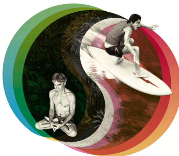
The Yin & Yang of Gerry Lopez

Azkenik, Bang Bang Zinemak saio arrakastatsua izan zituen 2022an ere parte hartzearen aldetik; bat, Beldurrezko Astearekin lankidetzan egin zen.