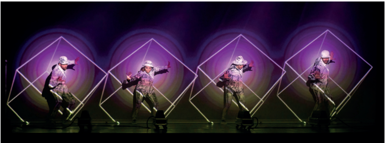
Around The World

Antzerkira datozen irakasleei aukera ematen jarraitu genuen, beren lan pedagogikoan esperientzia horretaz baliatu daitezten. Horretarako, ikuslearen prestakuntzarako gida batzuk egin ziren: hautaturiko ikuskizunari buruzko gogoetak eta informazioak, eta antzerki-lana ikusi aurretik edota ondoren ikasgelan egiteko jardueren proposamenak. Horiez gainera, ikusleari emozioak adierazteko bidea emango dioten iradokizunak.