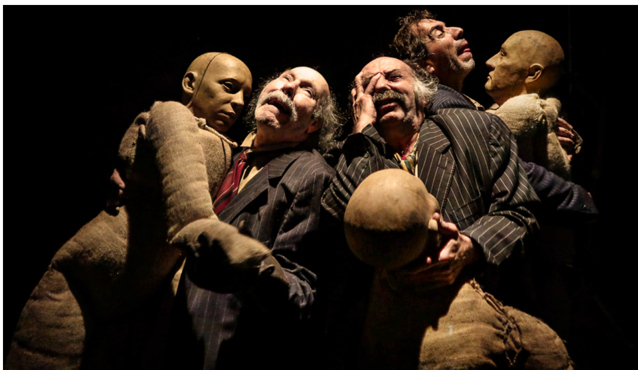
La batalla de los ausentes