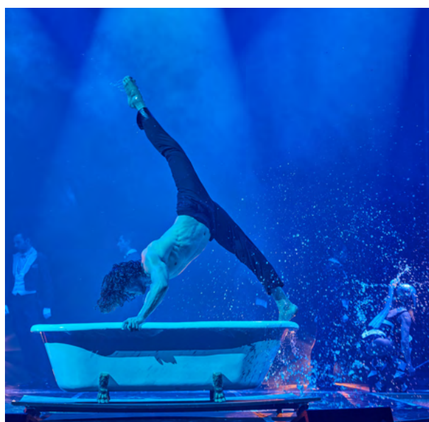
The Hole X