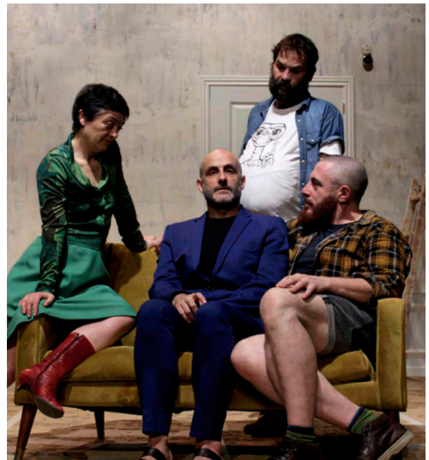
El Mono habitado

Euskal Herriko konpainiak: ERRE Produkzioak, El Mono habitado, Khea Ziater... abangoardia, ikus-entzule gazteak, eduki interesgarriak ezaugarri. Konpainia horiek beste leku batzuetatik etorritako konpainiekin partekatzen dute agertokia: Teatro del Navegante (Gaztela eta Leon) La Quintana Teatro (Galizia), Corral de García aragoitarra, Teatro Che y Moche edo Histrión Teatro (Andaluzia), zeinen ibilbide artistikoa bi osagai funtsezkoen gainean oinarritzen baita: testuaren defentsa, proposamen artistikoa irmo zurkaizten duen osagai estruktural gisa, eta interpretazioa interpreteen eta ikus-entzulearen arteko lotura estu gisa.