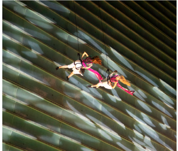
dFERIA, DENDU, Harrobi Dantza Bertikala Konpainia, Oreka TX

Azoka hau plataforma aparta da sektoreko eragileek elkar topa dezaten, non esperientziak, ezagutza eta arte-proposamenak trukatzeko aukera ugari bultzatzen baitira. Donostiako Azoka honek negozio-parte handia sortzen du zuzen nahiz zeharka, eta kalitatea ezaugarri duen merkatu bihurtu da.