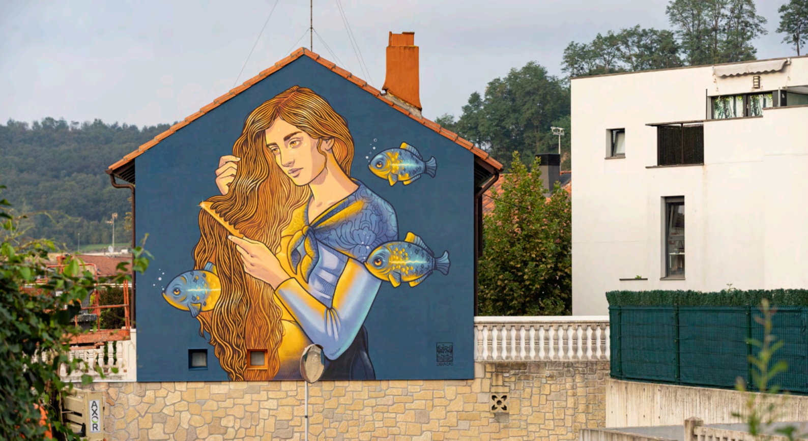
Donostia Apain, Lidia Cao © Iñaki Rubio