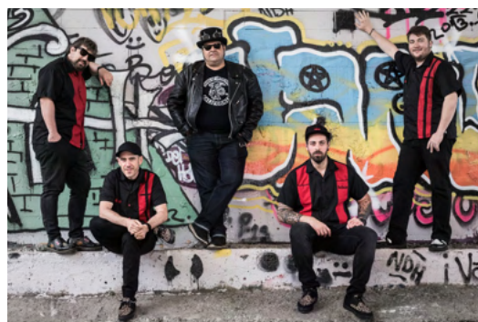
Zo Zongó!!, Rockalean

Aurreko urteetan bezala, lankidetzan estuan jardun genuen auzoetako eragileekin: IRESGI Fundazioa , AGIFES Fundazioa , Loiolatarra Kirol Elkarte , Hontza Kultur Elkarte , Arantzazuko Ama Ikastola , La Salle Ikastetxea , Emaus Fundazioa , Ur Kirolak Arraun Elkarte , Ibaiertz Abesbatza , Cristina Enea Fundazioa , Sarroeta , Lanberri eta Urumea Ibaia Auzo Elkarte .