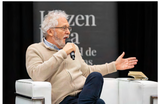
Hector Abad Facciolince, Literaktum