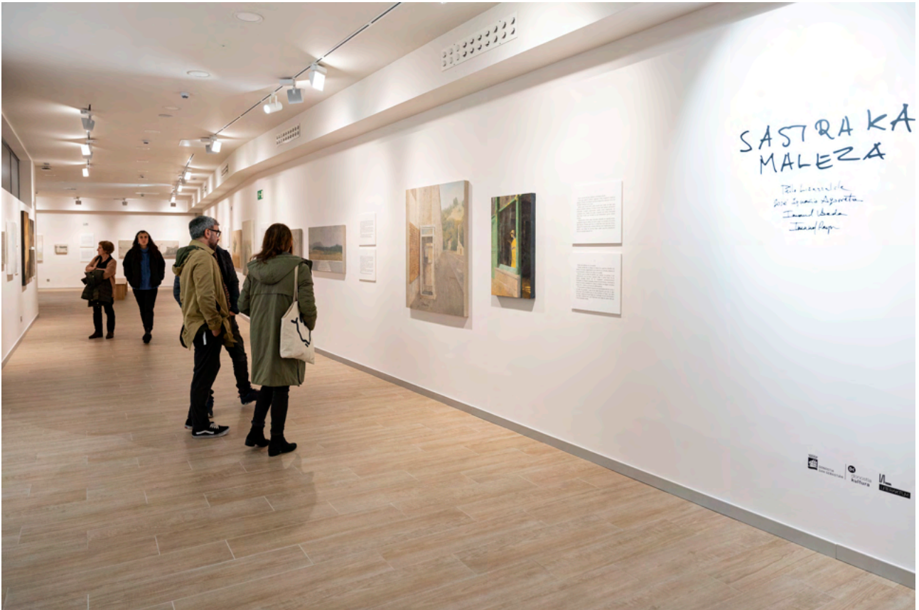
Exposición Sastraka Maleza