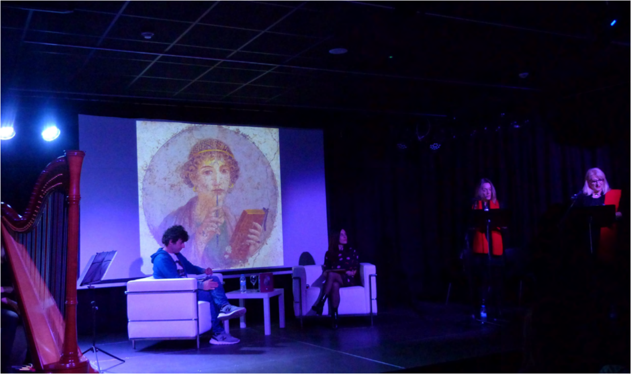
Safo, Semana de la Poesía

En lo que se refiere al teatro, en febrero tuvo lugar la obra japonesa Aiko , y en abril la performance Aurora Ocaso . Después llegaron las obras representadas en las fiestas veraniegas de los barrios: en Amara Viejo, el último espectáculo de Trapu Zaharra y el bertso-teatro para niños en Riberas de Loiola: Hairaren alpistegia . También en otoño hubo teatro en la sala principal del Centro Cultural: Grimm anaiaak , para el público infantil, y Don Juan Tenorio y Frankenstein agurgarria , para los adultos. Así como sesiones de magia y talleres de circo, tanto en verano como en Navidades ( Tor Magoa , Txoborro magoa , Xomorro zirku taldea ).