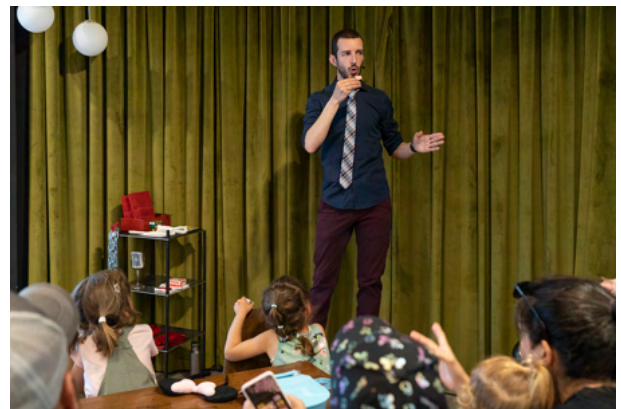
Sekreturik ez, Avenium. Teatro de Bolsillo

aplicadas al mundo del arte, actuaciones musicales durante tres noches y diversas esculturas expuestas tanto dentro como fuera de la iglesia, todas ellas en torno a la temática de la luz. Fue un éxito de público y de crítica, pues espectadores de todo tipo se acercaron para disfrutar del arte y de la música mientras se tomaban un trago o picaban algo.