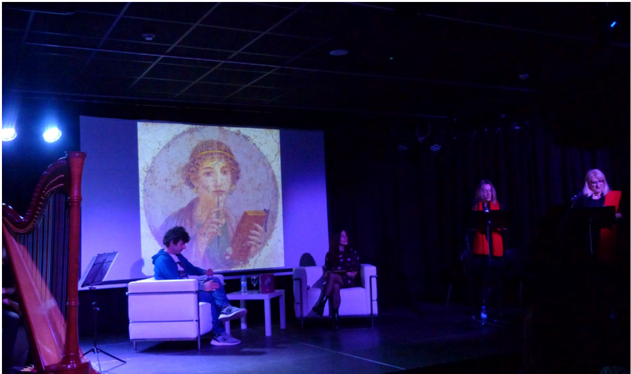
Safo, Poesia Astea

Antzerkiari dagokionez, otsailean Aiko antzerki japoniarra eta apirilean, Aurora Ocaso performancea izan ziren. Ondoren etorri ziren udako auzo jaietakoak, besteak beste: Amara Zaharrea Trapu Zahar ren azken ikuskizuna eta Loiolako Erriberatan haurrentzako bertso antzerkia: Hairaren alpistegia . Udazkenean ere izan zen antzerkia kultur etxeko areto nagusian: haurrentzako Grimm anaiak eta nagusientzat Don Juan Tenorio eta Frankestein agurgarria . Baita izan ziren magia emanaldiak eta zirku tailerrak, udan zein eguberrian ( Tor Magoa , Txoborro magoa , Xomorro zirku taldea ).