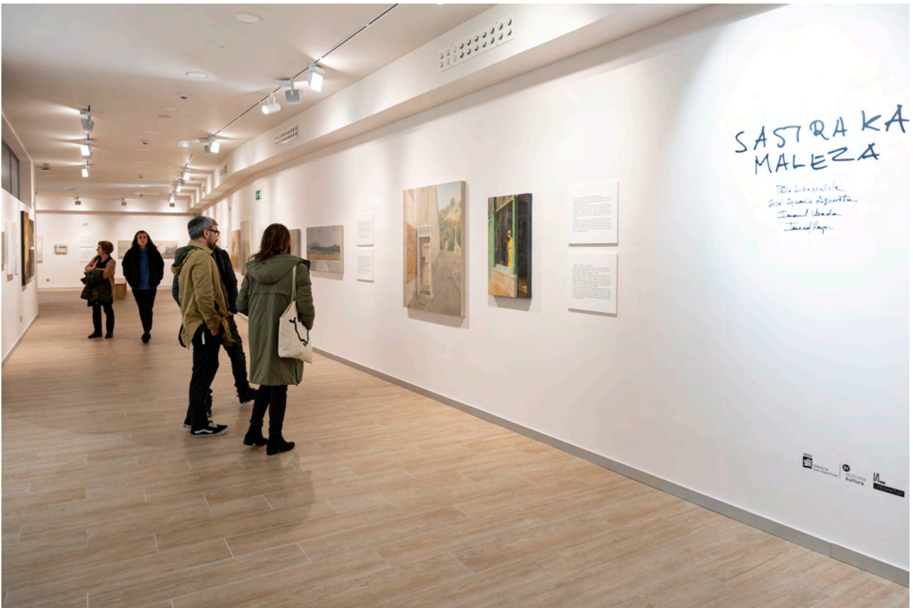
Sastraka Maleza erakusketa