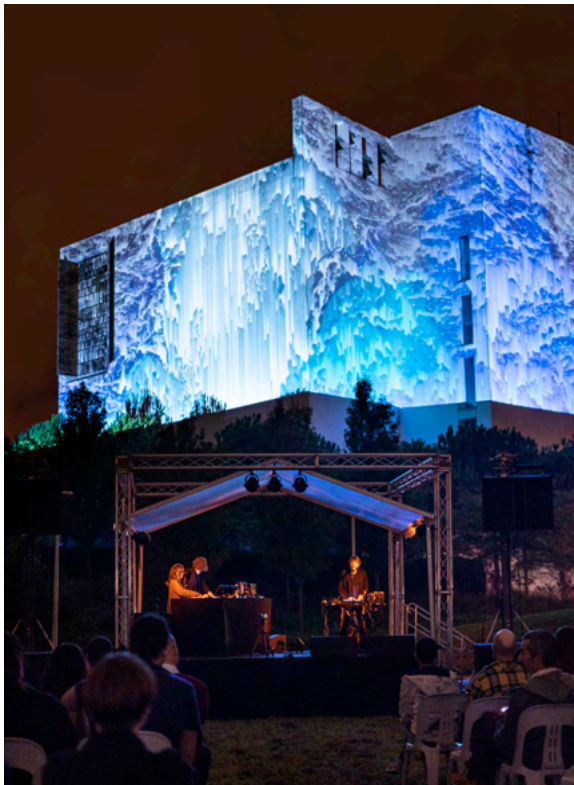
Dotore + Desilence