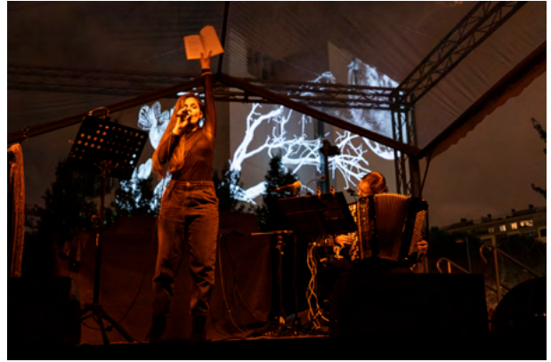
Huesos