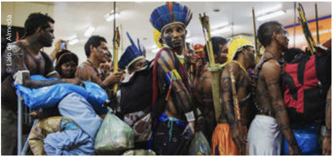
Lalo de Almeida, Mundurukuen protesta Belo Monten Protesta de los munduruku en Belo Monte , 2013. Artistaren kortesia Cortesía del artista.