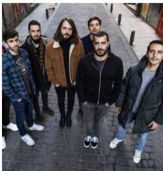
14 LA M.O.D.A.