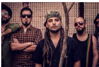
19 GREEN VALLEY