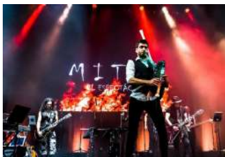
17 MITIC, EL ESPECTÁCULO