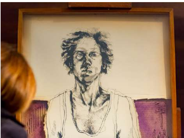
La Asociación de Amigos del Museo San Telmo donó una obra de Andrés Nagel

Y en cuanto al servicio de consulta externa, se ha atendido un número similar de consultas y peticiones de imágenes para reproducción o publicación similar al de años anteriores, más de 100 consultas que han generado documentación y 35 solicitudes de reproducción de imágenes. La consulta y el servicio de documentación internos han sido especialmente exigentes a la hora de dar respuesta a las necesidades documentales de exposiciones de producción propia u organizadas por el museo como Baginen Bagara o El viaje más largo , o de proyectos como el de Museo Bikoitza .