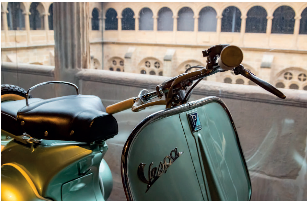
Vespa © Oskar Moreno