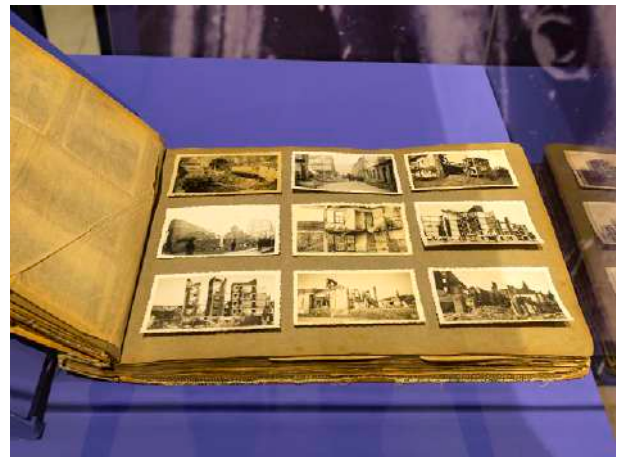
Fotografías Koch Bengoechea © Oskar Moreno