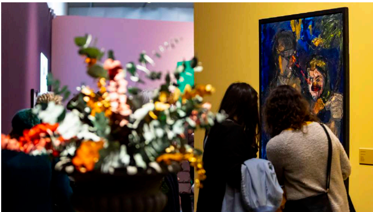
Baginen Bagara © Oskar Moreno