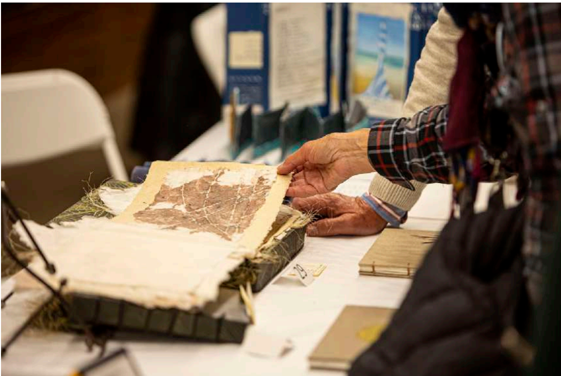
Libro de Artista © Oskar Moreno

Por último, hay que destacar que desde la biblioteca se ha dado impulso al proyecto de Archivo Oral de STM con la edición de las 20 entrevistas de testimonios recogidos en comercios centenarios realizadas en los últimos años y que próximamente se pondrán a disposición del público a través de la web.