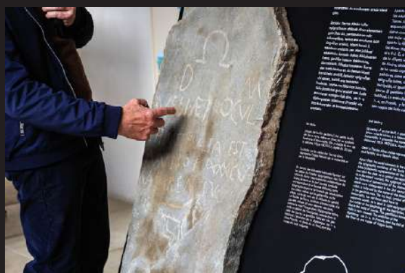
Exposición Estelas de Tierras Altas de Soria © Oskar Moreno