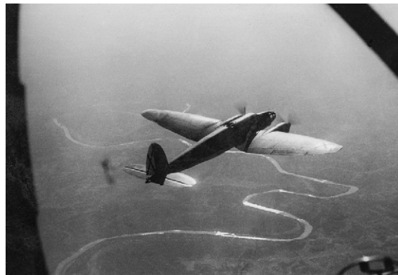
Exposición Entre el humo y la bruma. Sigfrido Koch Bengoechea

Destacamos asimismo la exposición Entre el humo y la bruma. Sigfrido Koch Bengoechea , en la que se pudieron ver imágenes inéditas de la guerra y de los bombardeos en diversas localidades vascas. Al abrigo de Urgull , que venía de 2020, se pudo visitar hasta el mes de mayo.