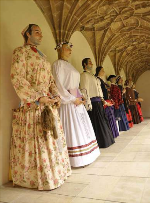
Gigantes en el claustro

La fotógrafa Carmen Ballvé nos acercó a las comunidades batey de República Dominicana en la muestra La mirada cercana , y el claustro ha sido el escenario para las lápidas encontradas en Soria con nombres de origen vasco.