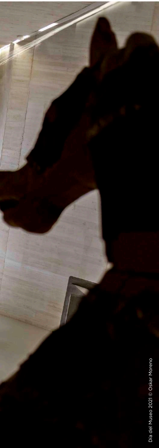
Día del Museo 2021