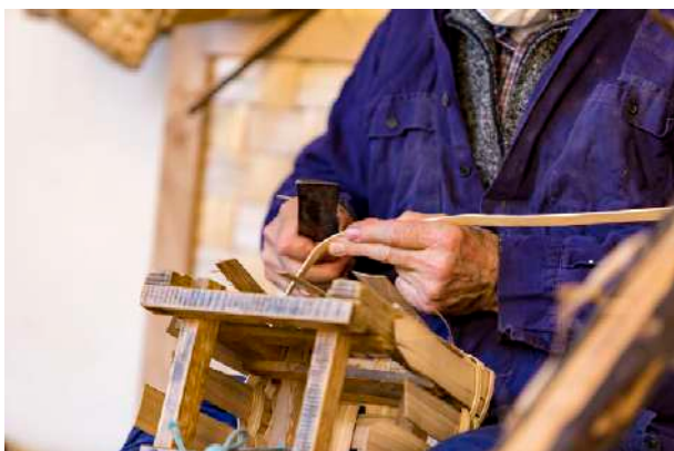
Trabajo de cestería en el claustro del museo

Se ha trabajado la relación cercana y directa con el público adaptando la oferta habitual de visitas guiadas de diferente tipo a las necesidades sanitarias de cada momento. Así, además de las visitas programadas a las exposiciones temporales, las miradas personales de las visitas de autor o las visitas temáticas del programa +55 se han ofrecido nuevas propuestas como la visita familiar a la exposición de El viaje más largo o la visita breve a la exposición permanente.