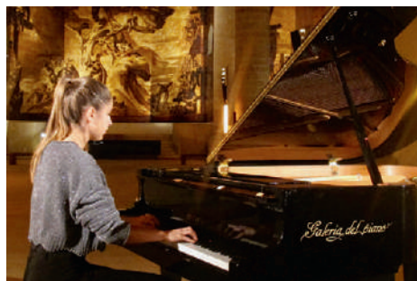
Actuaciones alumnado Francisco Escudero