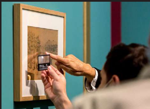
Exposición Al abrigo de Urgull