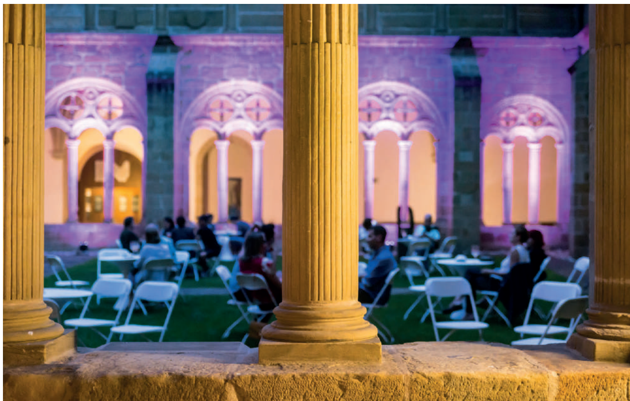
San Telmo Gaua

Por otra parte, las Jornadas Europeas de Patrimonio de este año han estado dedicadas a la accesibilidad y la inclusión, una oportunidad para poder mostrar la sensibilidad y compromiso de San Telmo para ser un espacio abierto a todas las personas, sin exclusiones.