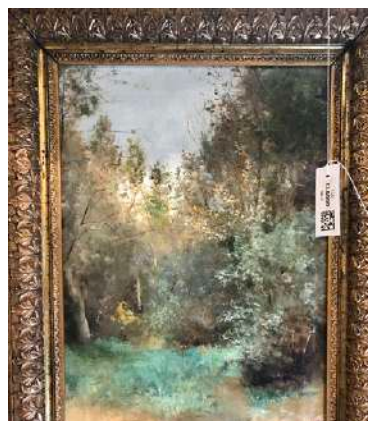
Gordailua Baginen Bagara

La conmemoración de los 10 años de San Telmo Museoa - Gordailua dio cobijo a numerosas actividades para dar a conocer la labor invisible y muchas veces desconocida de los museos y centros de patrimonio con un programa en el que expertos y expertas han explicado a lo largo del año los pormenores de diversos proyectos.