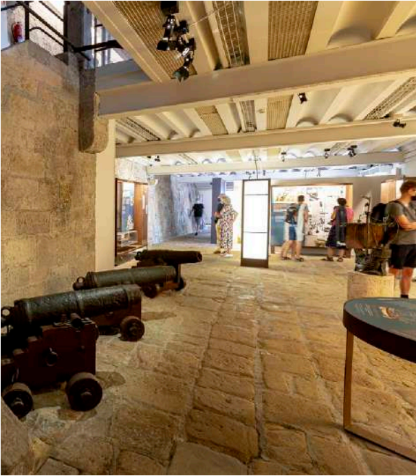
Casa de la Historia © Oskar Moreno