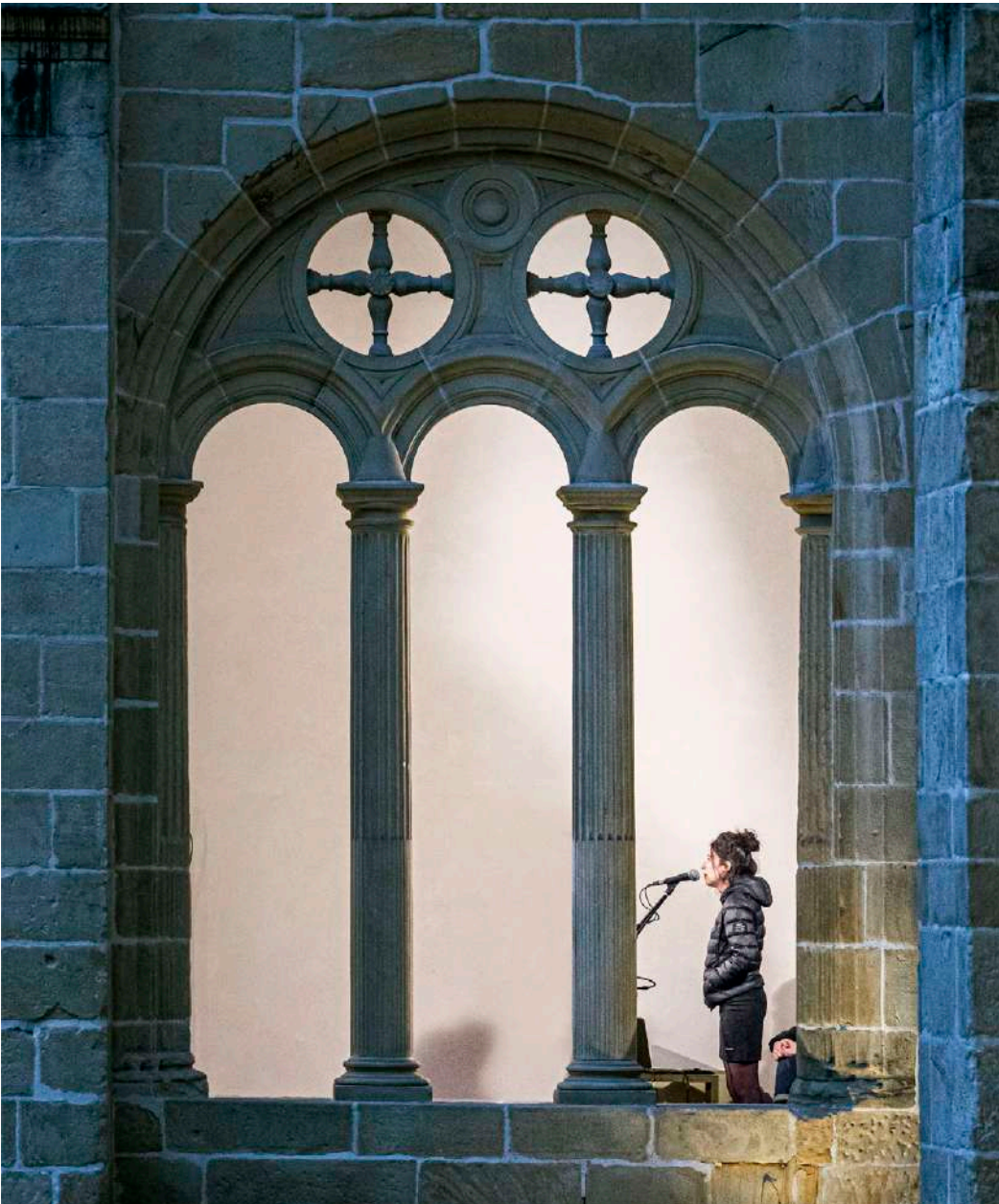
Bertsos saioa en el Museo

Todas las exposiciones temporales han contado con su propio programa de actividades para favorecer las múltiples lecturas y el acercamiento a diferentes tipos de público. Especialmente destacables las actividades vinculadas a la exposición El viaje más largo de este verano, así como las múltiples miradas y reflexiones propuestas en torno a la exposición Baginen Bagara .