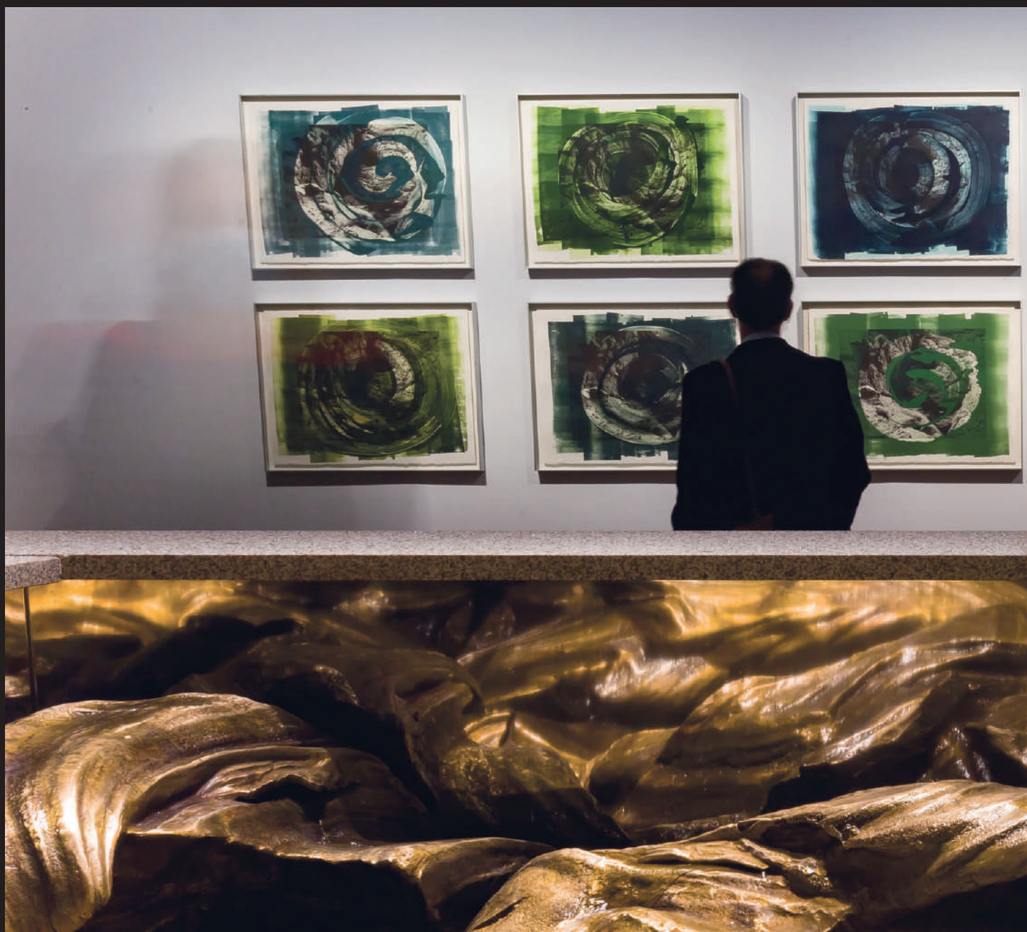
Exposición Hondalea