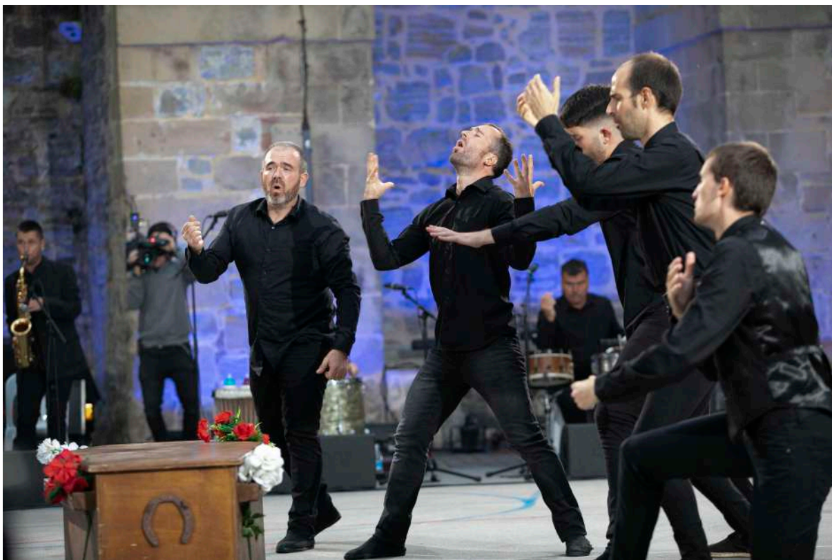
Tio Teronen Semeak

Sigue quedando claro que la Comparsa de Gigantes continúa teniendo un gran tirón entre el público infantil y la exposición que, junto con el Museo San Telmo , organizamos en el claustro del museo atrajo a un público numeroso y de carácter familiar. Los escape street que se realizaron tanto en euskera como en castellano tuvieron incluso lista de espera y todas las plazas ofertadas se cubrieron.