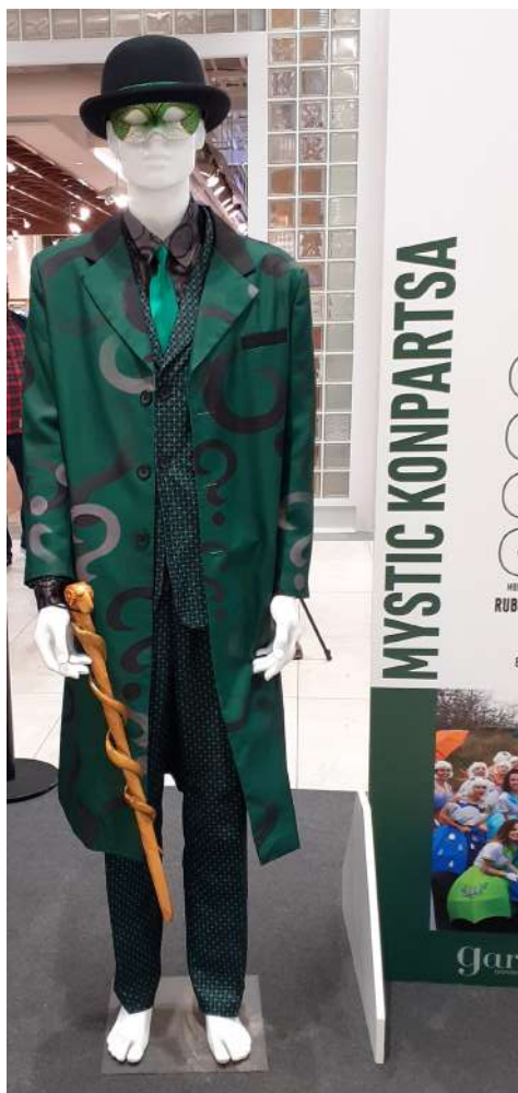
Exposición en Garbera

Las diferentes comparsas de Inude eta Artzainak no pudieron salir debido a la pandemia.