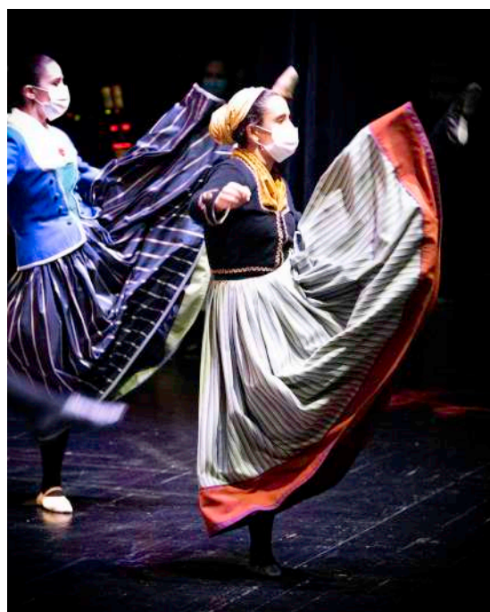
Presentación Tamborrada

En definitiva, un amplio abanico de actividades para celebrar de otra forma nuestro día más grande.