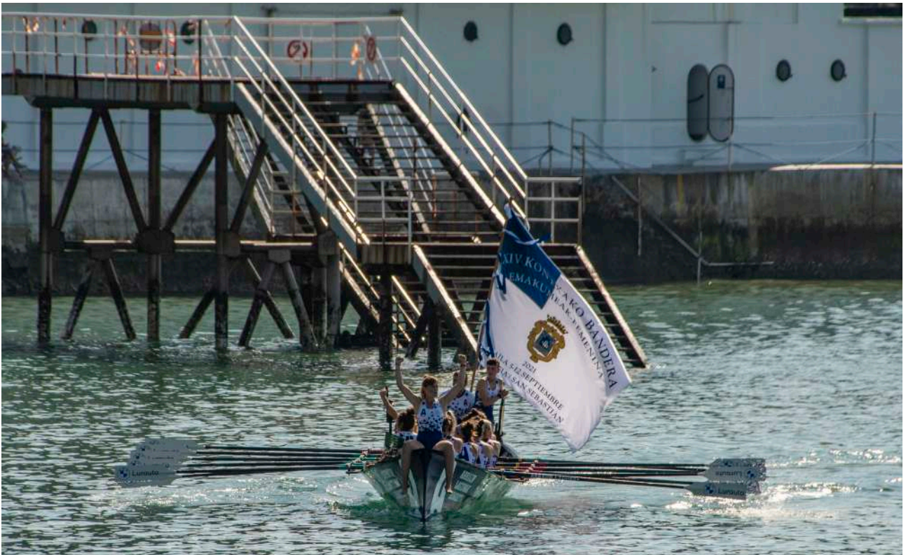
Regatas - Arraun Lagunak

Un año más se entregaron los Premios ADEGI Fabrika Nueva Cultura – este año alcanzaron su VI edición - a la mejor trainera guipuzcoana tanto de la modalidad femenina como de la masculina.