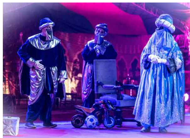
Baltasar y los Pajes

No solo los más pequeños fueron los destinatarios de los mensajes y saludos de sus Majestades; nuestras personas mayores, aquellas que viven en las diferentes residencias de nuestra ciudad fueron las receptoras de un cálido mensaje en el que Melchor, Gaspar y Baltasar - conscientes de que no podrían acudir en persona a visitarles tal y como lo viene haciendo durante los últimos años - les transmitieron sus mejores deseos y ánimo para afrontar la situación en la que nos encontrábamos a través de un vídeo.