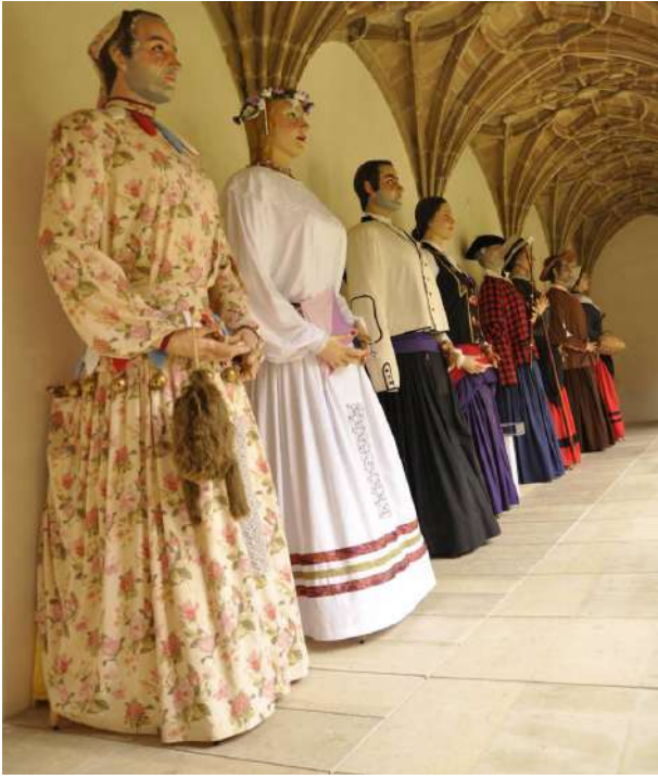
Exposición Museo San Telmo