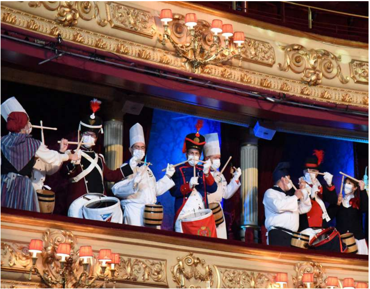
Tamborrada en el palco