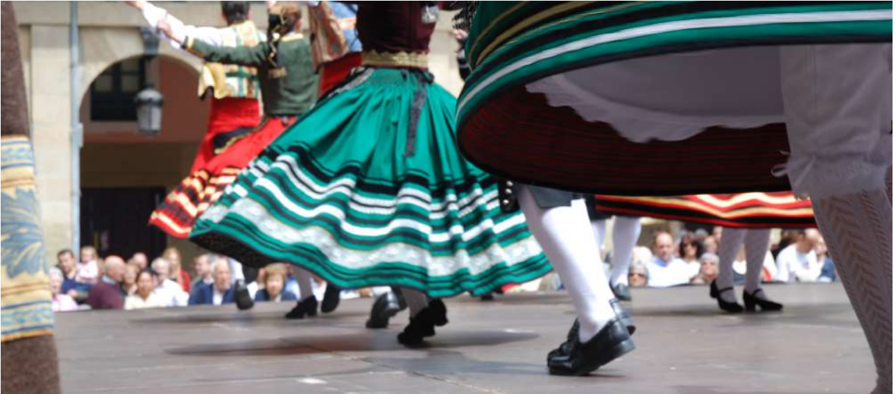
Casas Regionales ediciones anteriores