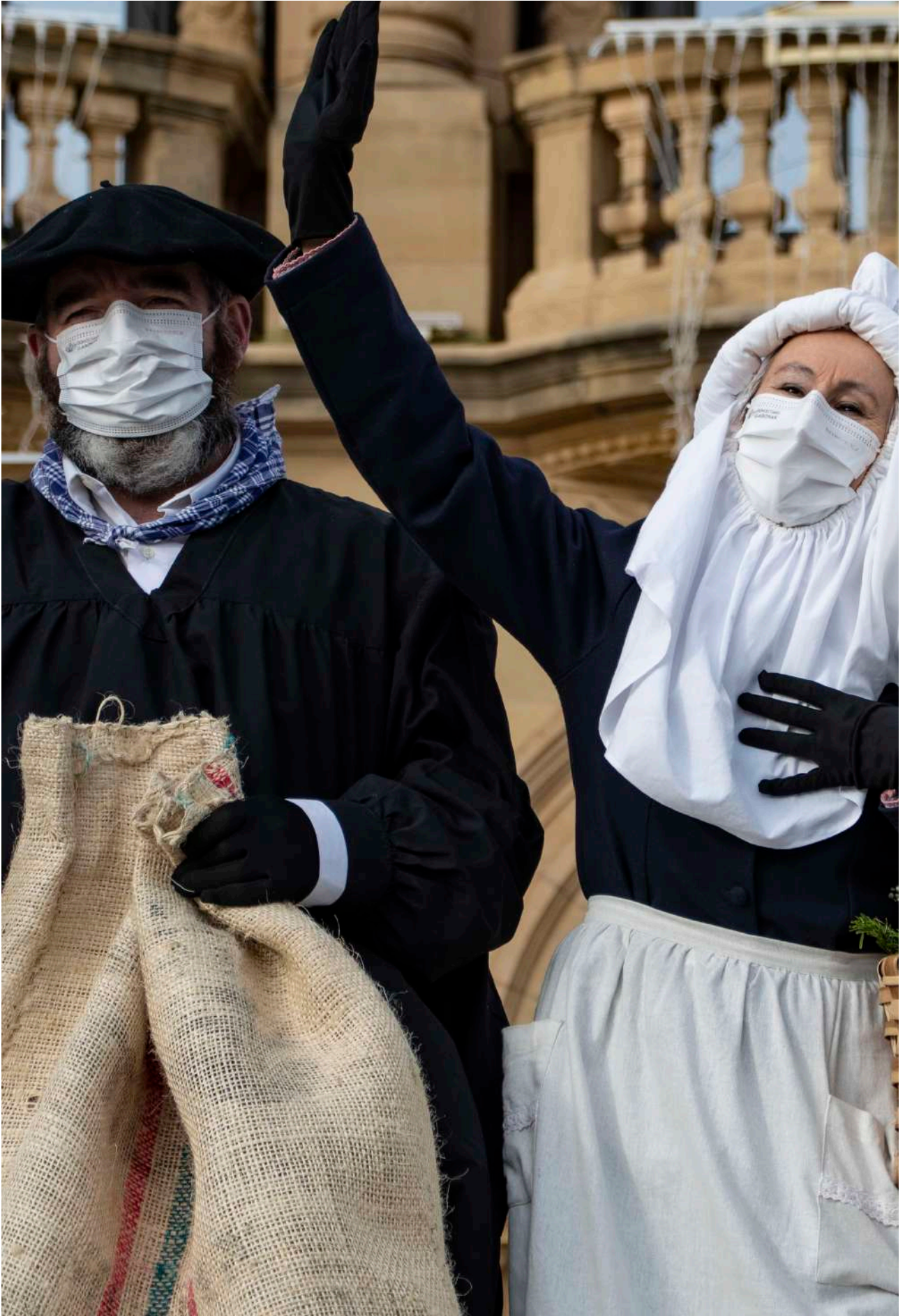
Olentzero eta Mari Domingi