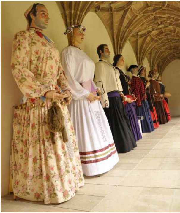
Erakusketa San Telmo Museoan