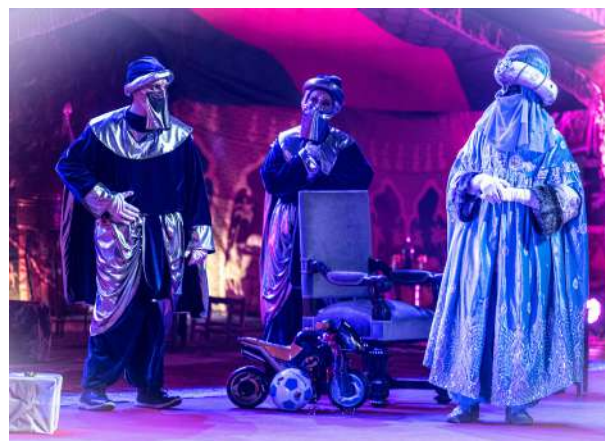
Baltasar erregea eta Pajeak

Txikiak ez ziren bakarrak izan Erregeen mezu eta agurrak jasotzen; gure zaharrek ere, Donostiako egoitzetan bizi direnek, omenaldi beroa jaso zuten, zeinaren bidez Meltxor, Gaspar eta Baltasar, jakinik ezin zirela bertaratuko bisita egitera azken urteetan egin ohi duten bezala, nola eta bideo baten bitartez adierazi eta opa baitzizkieten beren asmorik onenak eta animoak, dugun egoera honi ahalik eta ondoen aurre egiteko.