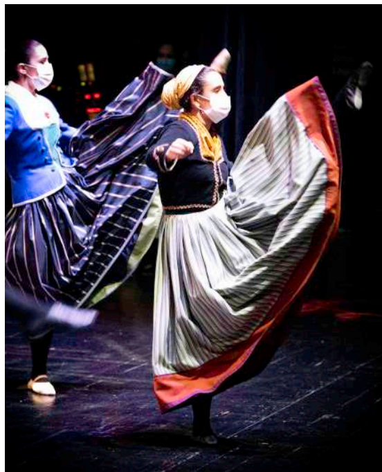
Danborradaren aurkezpena

Guztira, jarduera sorta zabala, gure egun handiena beste era batera ospatzeko.