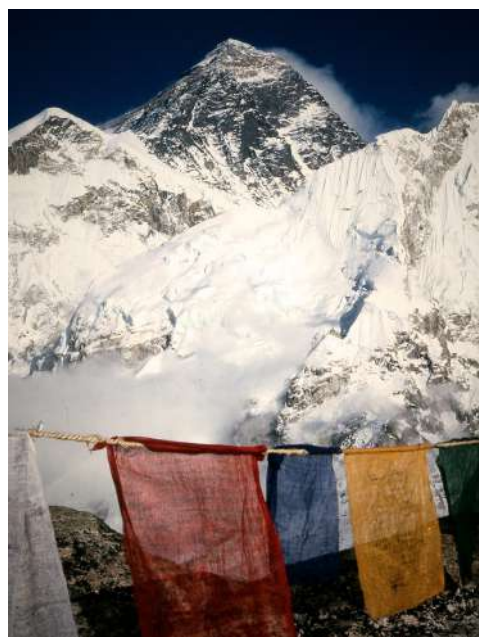
Everest -The Hard Way - Menditour 2021

El Cine Club Kresala volvió por último a entregar a finales de año su tradicional premio acompañado de película, en esta ocasión homenajeando al Festival de Cine Africano.