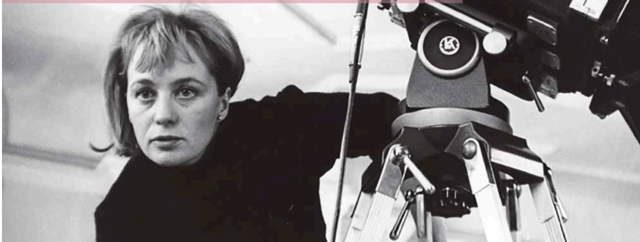
Ciclo Mai Zetterling

Las sesiones de Cine y Montaña de Menditour continuaron en enero con buena acogida, como la tuvieron la extensión del festival Zinegoak (abril), y el nuevo ciclo de Emakumeen Etxea , consagrado en esta ocasión a la cineasta Mai Zetterling .