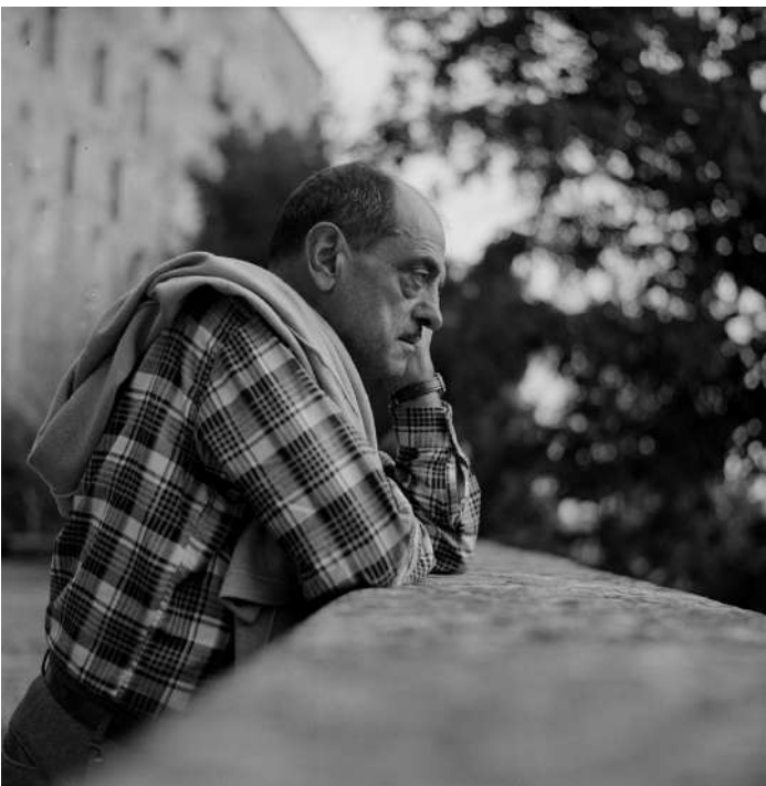
Buñuel en Toledo - Nosferatu

Este año el público de nuestras actividades audiovisuales ha demostrado su compromiso con la exhibición de cine en gran pantalla como experiencia colectiva, respondiendo, pese a todas las limitaciones, al esfuerzo de nuestra programación institucional y la realizada en colaboración con otras entidades.