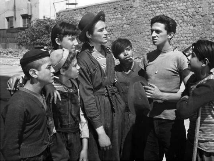
Los olvidados - Nosferatu Buñuel