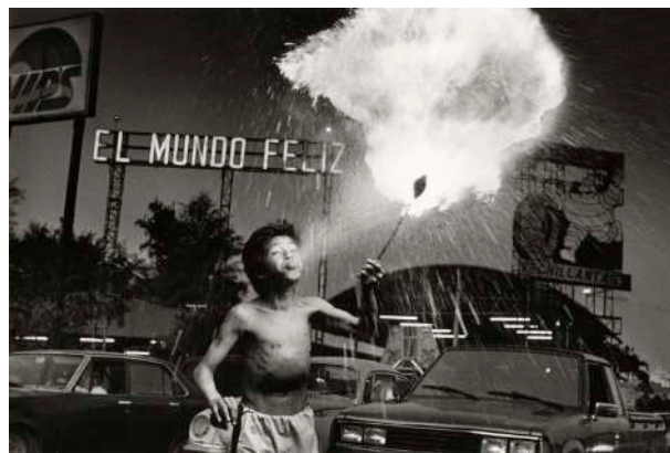
Creadores de conciencias - El Salvador