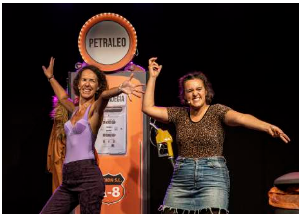
Beteingoiagu - Festival Teatro de Bolsillo (Fotografía: Iñaki Rubio)

Asimismo, gracias al trabajo colaborativo se materializaron los ciclos francés y alemán, gracias a nuestros socios Institut Français y el Instituto Goethe. Así como la serie de mesas redondas sobre la memoria histórica, con la ayuda de la asociación Goldatu. Por el contrario, otros ciclos que se realizan en colaboración no pudieron tener el desarrollo esperado. Por ejemplo, la Semana de la Salud, por citar uno.