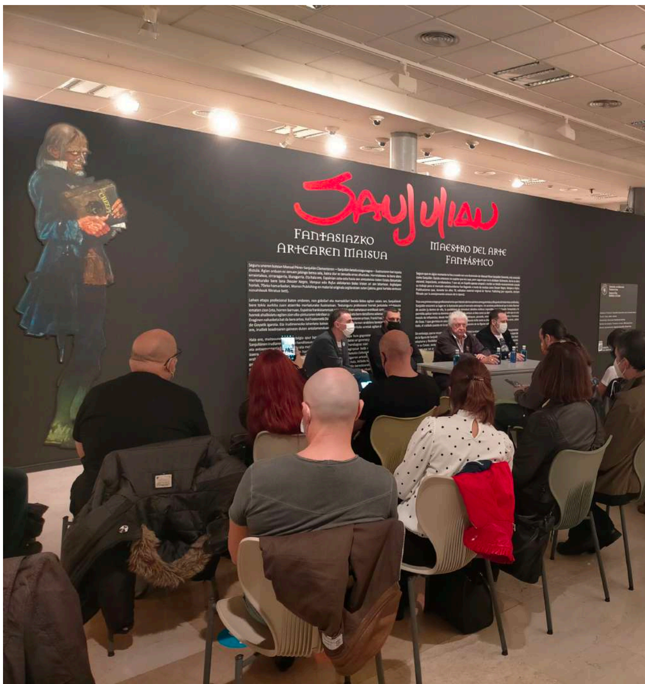
San Julian. Beldurrezko Astea

Durante el año 2021, el desarrollo de la pandemia volvió a condicionar la agenda y formatos de las actividades del Okendo Kultur Etxea . Tanto los programas como las actividades fueron recuperándose poco a poco, junto a las medidas correspondientes a cada momento. Teniendo en cuenta las limitaciones y la situación, la casa de cultura hizo una amplia oferta tanto a la ciudadanía en general como a los agentes culturales, y todos ellos respondieron con ilusión a las oportunidades de que dispusieron.