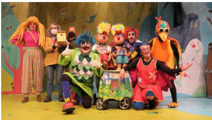
Kuiki - Pirritx, Porrotx eta Marimotots

En este apartado de trabajo junto a otras entidades, este año también se colaboró con la asociación Plazara Goaz en la programación de la obra Kuiki de Pirritx, Porrotx eta Marimotots , cuyo estreno fue, como siempre, un éxito de participación del barrio, agotándose todas las entradas en apenas unos minutos. Esta actividad, al igual que otros años, se enmarcó dentro de la iniciativas en favor del euskera. Además, con Plazara Goaz se ofrecieron a lo largo del año diferentes tertulias literarias en euskera, dinamizadas por Iratxe Retolaza y que acercaron la literatura en euskara a la ciudadanía.