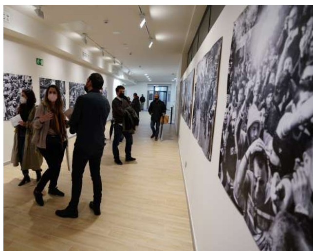
Exposición El otro lado