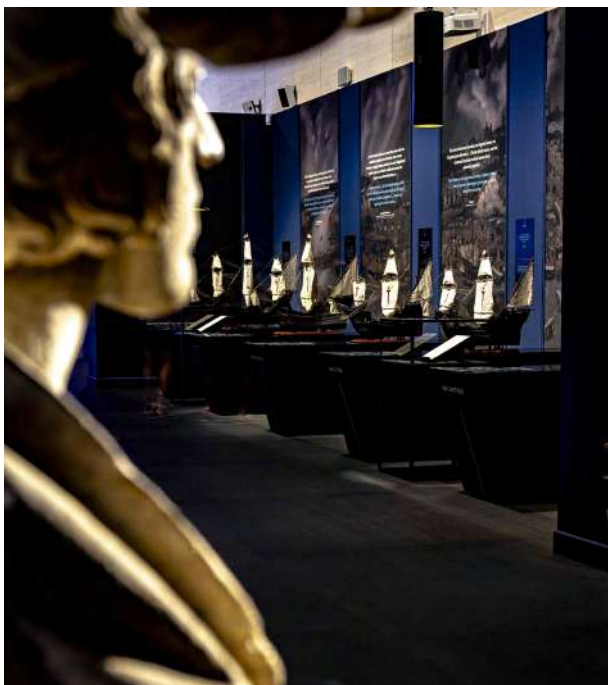
STM, Elkano

En medio un año difícil, con permanentes contratiempos (cancelaciones, cierres perimetrales, cambios de programación, devoluciones de entradas, etc..), en el que -sin embargo, las medidas de protección sanitaria adoptadas bajo el lema Cultura: Disfrútala con salud se mostraban totalmente eficaces. Y, sobre todo el público daba una acogida realmente cálida a la extensa oferta cultural que Donostia Kultura ha mantenido este año.