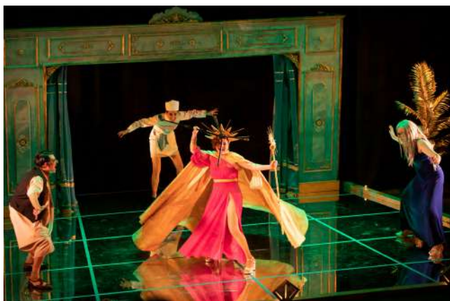
La cresta de la ola, La Estampida © Gorka Bravo