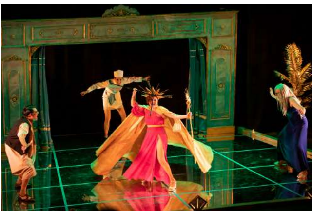
La cresta de la ola, La Estampida