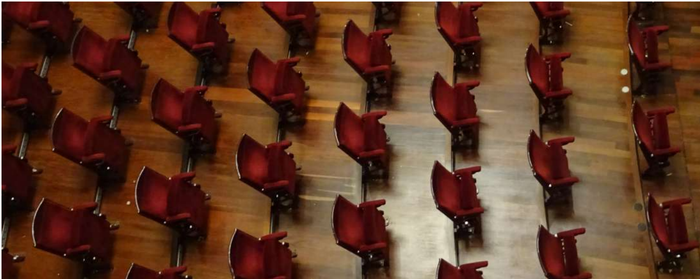
El Victoria Eugenia, con menos butacas, por las medidas de seguridad.

2 020an, Donostia Kulturako Ekoizpen Unitateak 405 ekoizpen egin zituen, Victoria Eugenia Antzokian, Antzoki Zaharrean, San Telmo Museoan, Kursaal zentroan eta beste gune batzuetan egindakoak batuta. Horrek esan nahi du 2019koa baino askoz gutxiago izan zirela (-%54), aretoak ixtearen eta jarduerak gutxitzearen ondorioz, Covid-19a zela eta.