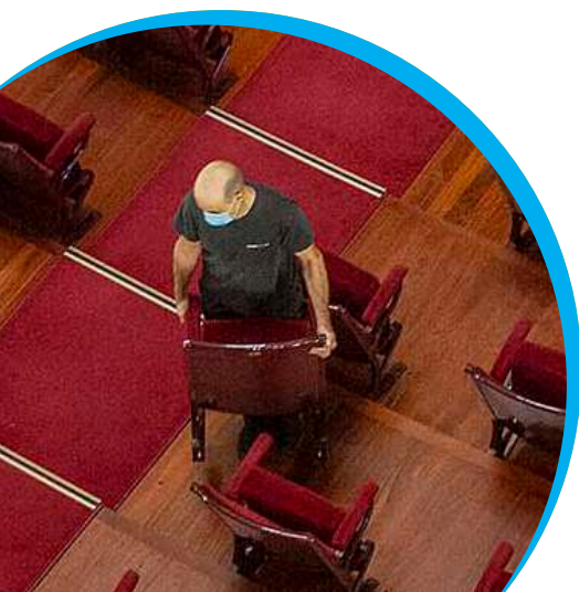
Operario retirando butacas.

Por último, mencionar la renovación del Convenio de PAUSO BERRIAK con GUREAK FUNDAZIOA y ATZEGI, programa dirigido a facilitar el trabajo de las personas con discapacidad intelectual en empresas e instituciones del entorno ordinario.