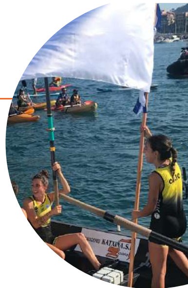
Trainera femenina de Orio.