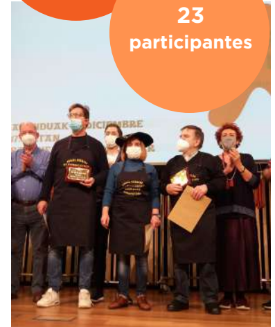
XXV Concurso de Chistorra de Euskal Herria.