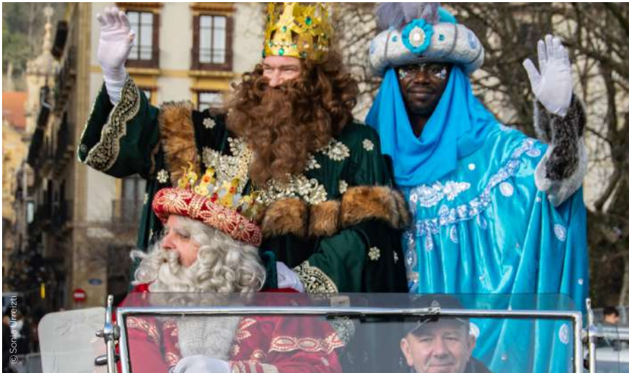
Sus Majestades Los Reyes Magos de Oriente.