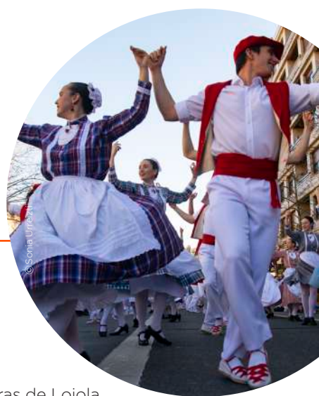
Inudeak eta Artzainak.