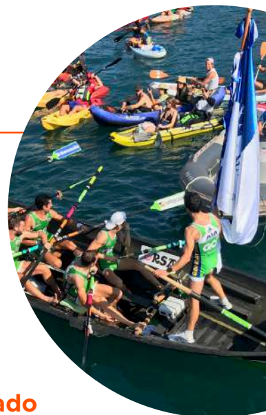
Trainera masculina de Hondarribia Arraun Elkartea.