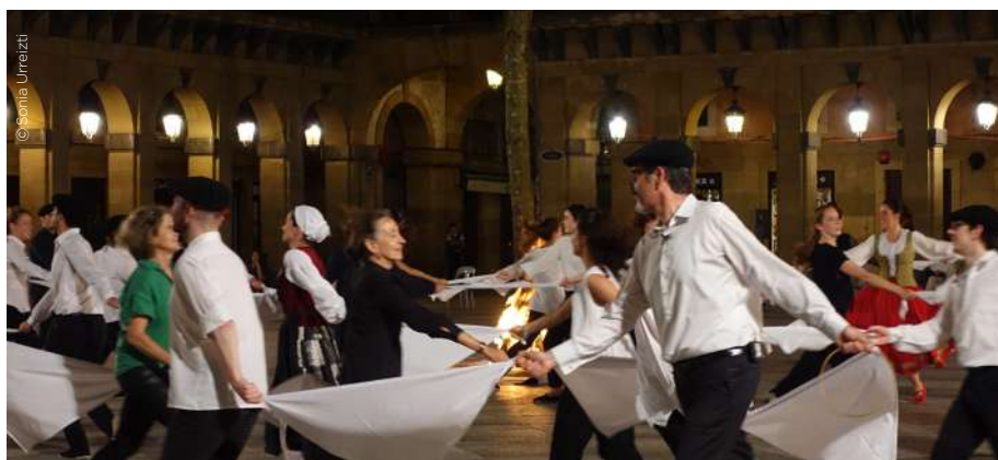
Vispera de San Juan en la plaza de la Constitución.