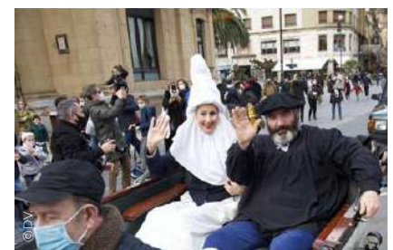
Olentzero y Maridomingi.

Lo que no se pudo celebrar fue la tradicional recepción en el ayuntamiento. En su lugar, los días 23 y 24 de diciembre se programó un espectáculo infantil en el Teatro