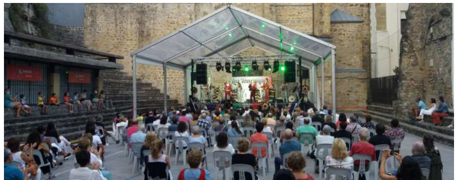
Concierto en la plaza de la Trinidad. Abuztua Donostian.

No obstante, nos vimos obligados a cambiar nuestro criterio habitual y cambiamos de estar en los lugares por donde el público pasa a estar en lugares a los que el público tuvo que llegar para poder encontrarnos, cambiamos los horarios, nos olvidamos de la noche, de los fuegos artificiales, el público tuvo que permanecer sentado y cumplir con la distancia social... Aún así, Abuztua Donostian funcionó.