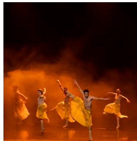
Dream. Cie Julien Lestel.

Estrenos en Euskal Herria: Picnic on the moon , Llego tarde ; Future Lovers , La tristura ; Amiga , Tribueñe ; Próximo , Tímbr 4 ; Cuando todo cambia (clic) , Teatro Calderón &